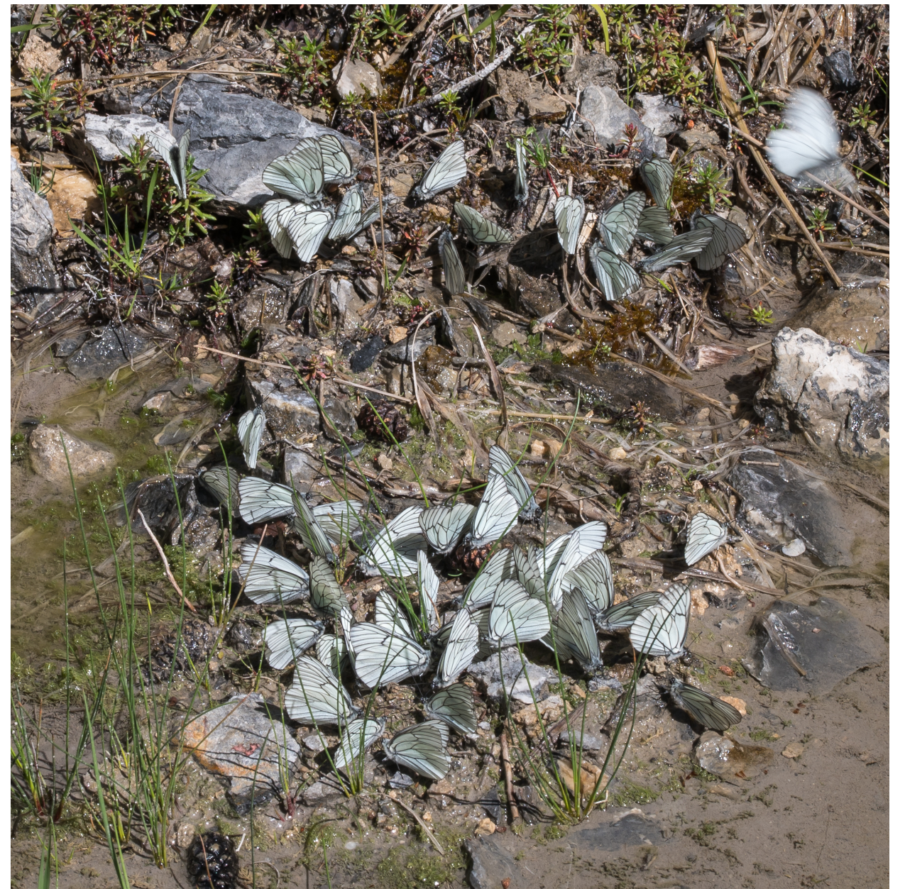
Falter an einer feuchten Bodenstelle