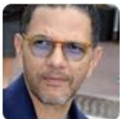
Roschdy Zem Philippe - le capi...