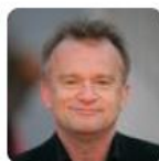
Dominique Pinon Robert