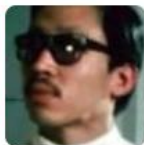
Thang-Long Papa Bong