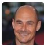
Bernard Campan Philippe