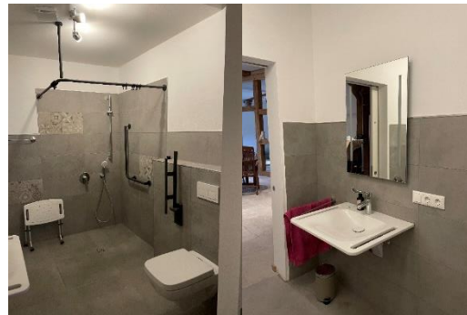
Abbildung 5: Pflegebad

Neben einem überdachten Plätzchen unter der Remise steht hinter der Küche eine neu angelegte Südterrasse zum Aufenthalt im Freien zur Verfügung.