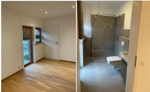
Abbildung 6: Zimmer 1 und Bad 1 (Dusche und WC)