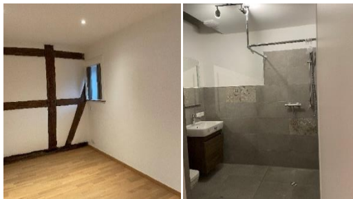
Abbildung 7: Zimmer 2 und Bad 2 (Dusche und WC)