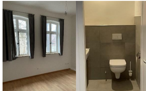
Abbildung 9: Zimmer 4 und Bad 4 (WC)

Zimmer 3 und 4 können mit Durchgangstür verbunden und gemeinschaftlich genutzt werden