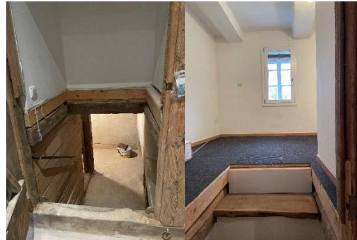
Abbildung 4: Keller und Upkammer

Die gesamte Wohnung ist weitestgehend barrierefrei (mit Ausnahme des Kellers und der Upkammer) – die Upkammer kann für Besuch oder Pflegekräfte auch zur Übernachtung genutzt werden.