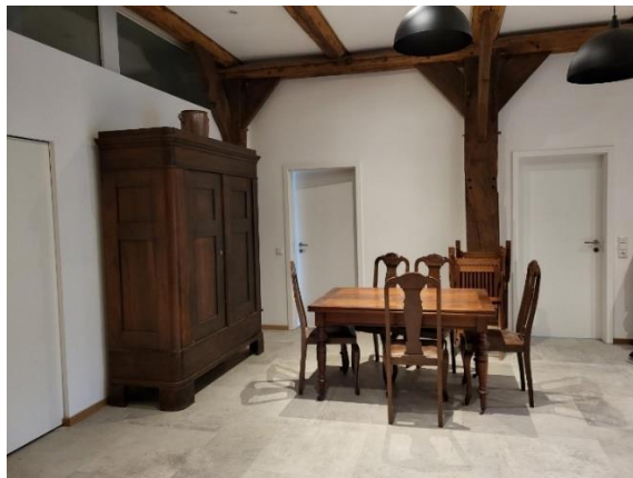
Abbildung 3: Diele

Natürlich können nach Absprache auch eigene, liebgewönne Möbel mit in die Gemeinschaft mit eingebracht werden.