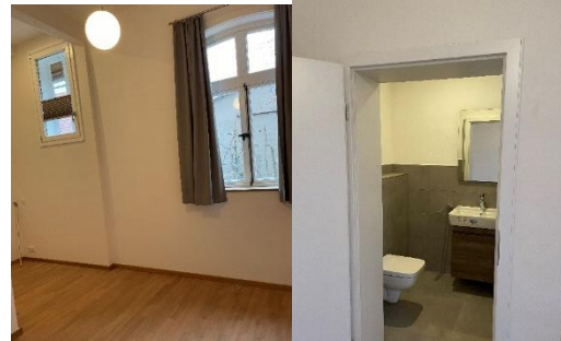
Abbildung 8: Zimmer 3 und Bad 3 (WC)