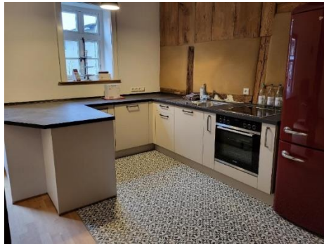
Abbildung 2: Küche

Die Gemeinschaftsräume, Küche und ein Hauswirtschaftsraum sind mit notwendigen Geräten und Inventar ausgestattet und kann aber auch jederzeit gerne um eigenes Inventar ergänzt werden in Abstimmung mit der Gemeinschaft.