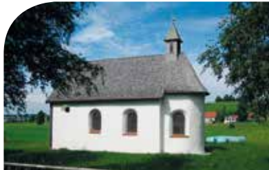
4| Kapelle St. Ursula in der Staig