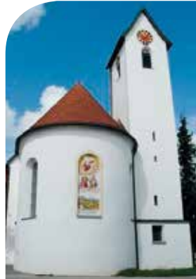
2| St. Sebastian – Wildberg