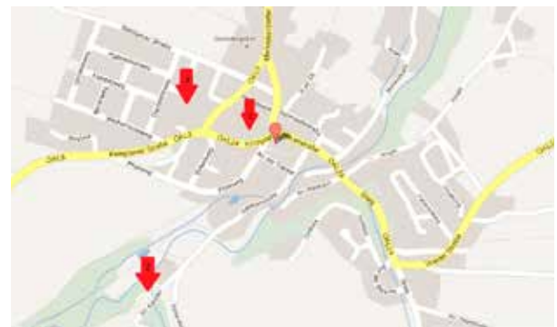
1 | An der Grundschule 2 | Am Kalkofen 3 | In der Furche