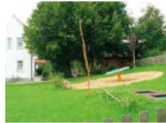
„An der Grundschule“