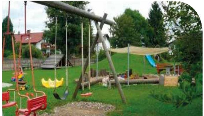
„In der Furche“