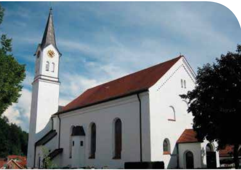
1| Pfarrkirche St. Oswald