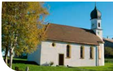
5| Kapelle Hl. Petrus von Alcantara