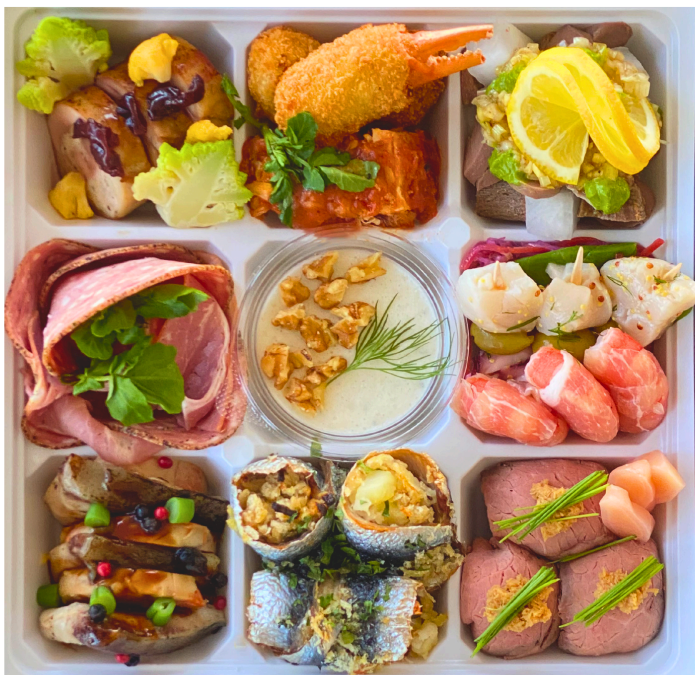
(写真は3名様用のセットです)