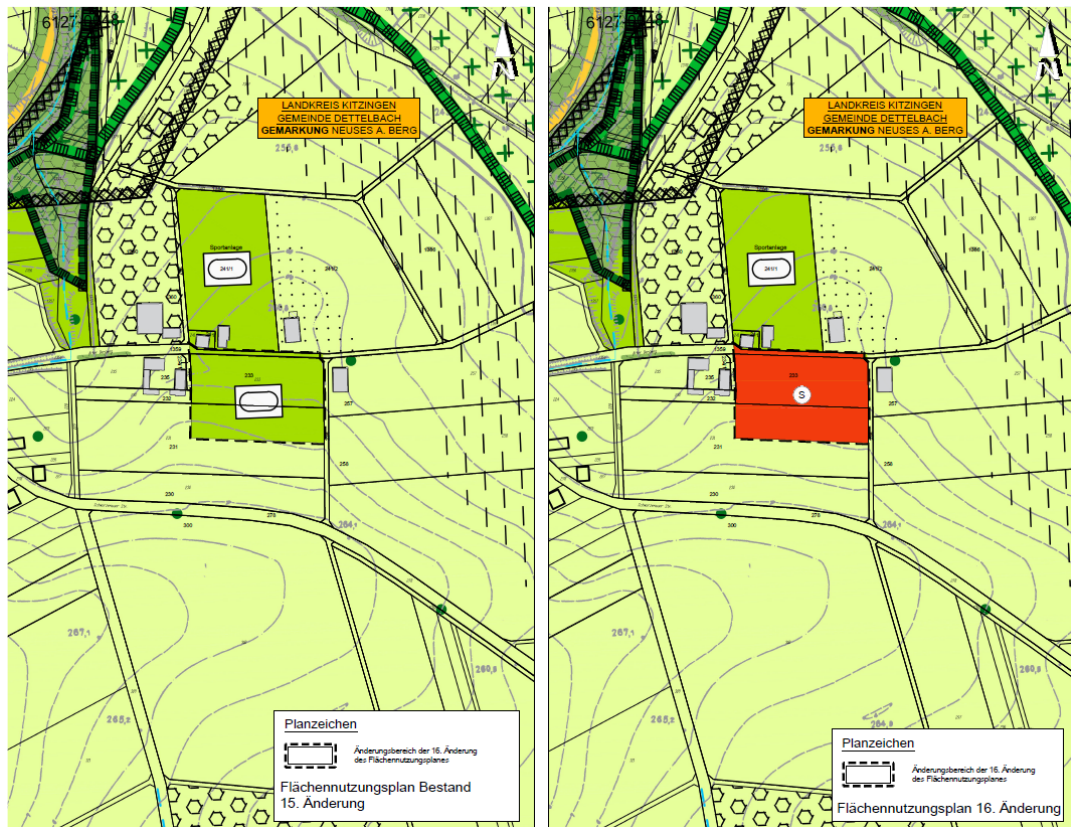
Abbildung 2 Übersicht wirksamer FNP und 16. Änderung