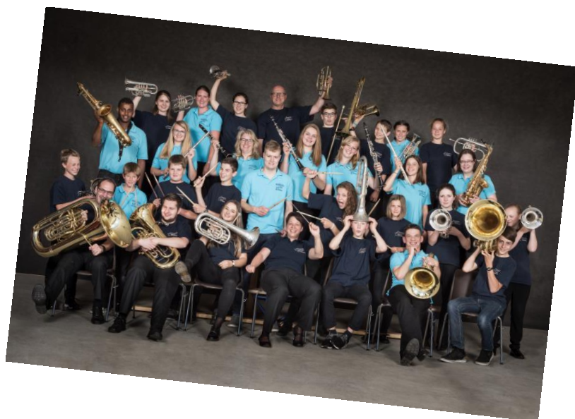
Gemeinsames Projekt mit der Jugendmusik Ursenbach 2017