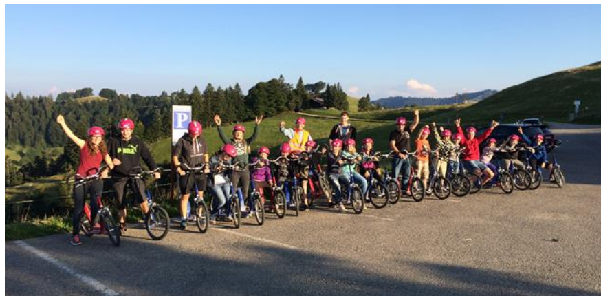
Jugendmusik Walterswil auf Achse