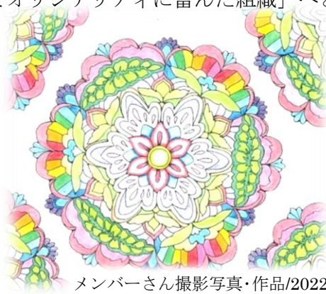
メンバーさん撮影写真・作品/2022 春