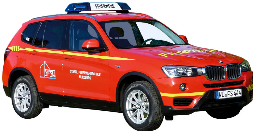
Abb. 15 KdoW

Hinweis: Die Definition des Einsatzleitwagens (ELW) ist identisch mit der Definition des Einsatzleitfahrzeuges.