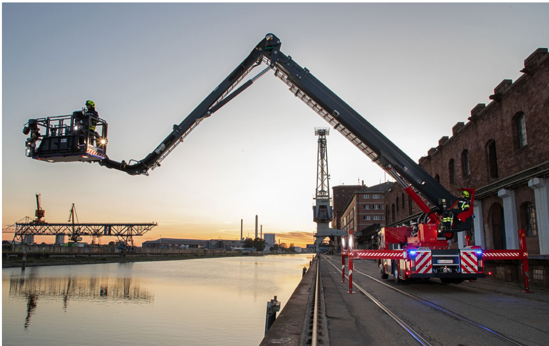
Abb. 9 TGM

1 Wendekreis zwischen Wänden: Durchmesser des kleinsten gedachten Zylinders, in dem das Fahrzeug bei größtem Lenkeinschlag wenden kann.