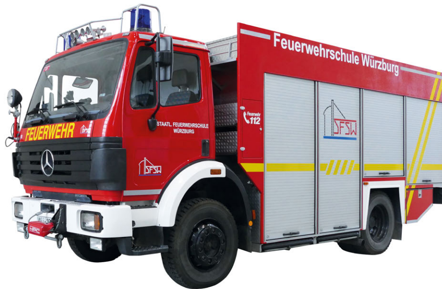
TABELLE 3: RÜSTFAHRZEUGE

1 Funkrufkennzahl 51 für Rüstwagen mit Zusatzbeladung Öl