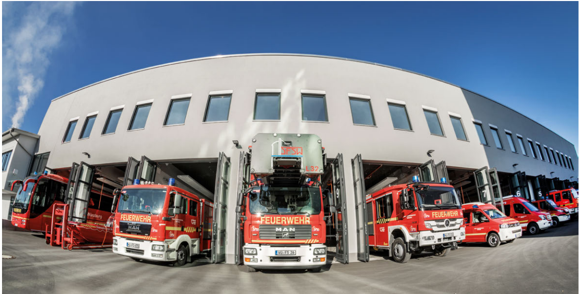
Abb. 1 Feuerwehrfahrzeuge

Feuerwehrfahrzeuge werden nach der DIN EN 1846-1 nach ihrer hauptsächlichen Verwendung in die folgenden Typen unterteilt: