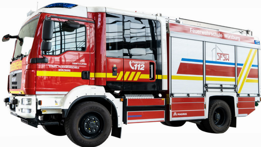
Abb. 4 HLF 10