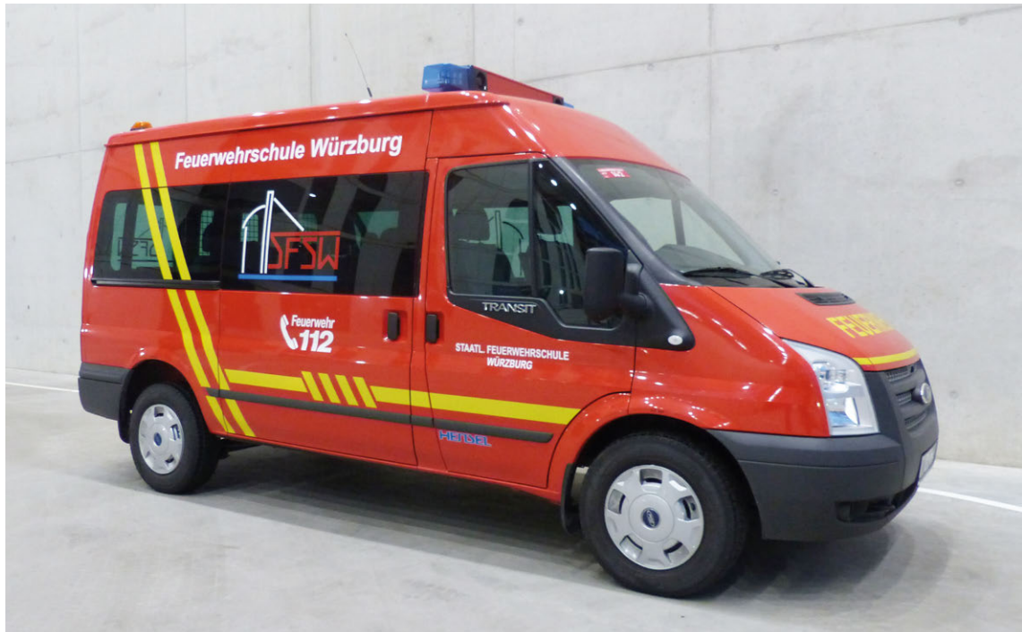
Abb. 17 MTW

Der Mannschaftstransportwagen (MTW) ist ein Feuerwehrfahrzeug, geeignet zur Aufnahme mindestens einer Staffel (1/5). Er ist vorrangig zum Transport einer Mannschaft bestimmt. Die technischen Anforderungen an MTW sind in einer „Technischen Baubeschreibung“ geregelt.