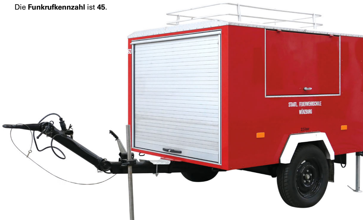
Abb. 24 TSA