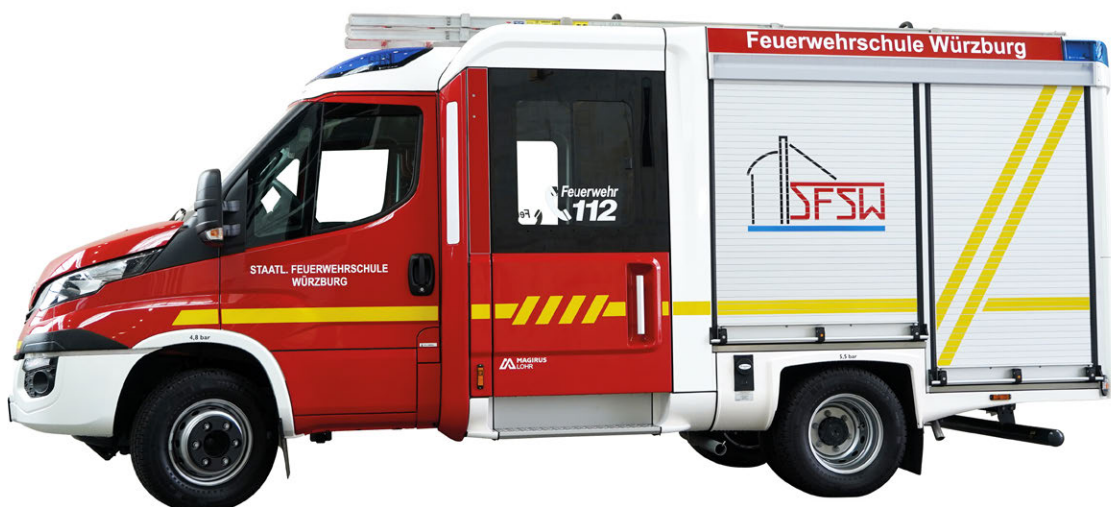
Abb. 2 TSF-W