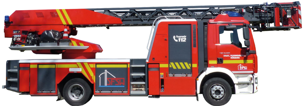
Abb. 8 DLAK

zur Rettung von Menschen aus größeren Höhen, weiterhin auch zur Durchführung technischer Hilfeleistungen und zur Brandbekämpfung verwendet.