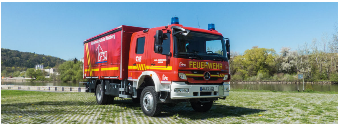
Abb. 20 Versorgungs-Lkw

Die Funkrufkennzahl für Versorgungs-Lkw ist 56 .