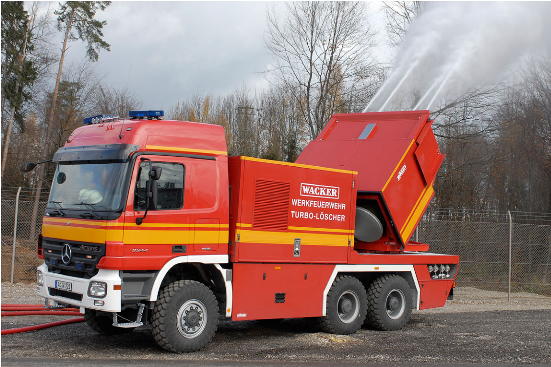
Abb. 7 Sonderlöschfahrzeug

Die Funkrufkennzahl für Sonderlöschfahrzeuge ist 49 .