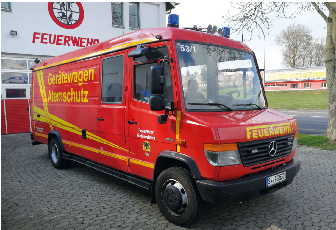
Abb. 12 GW-A