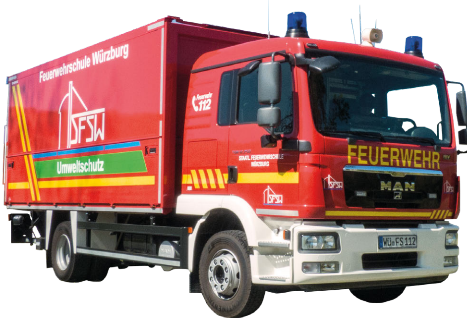
Abb. 14 GW-G

Der Gerätewagen Gefahrgut (GW-G) nach DIN 14 555-12 dient dem Transport der Ausrüstung für übliche ABC-Lagen. Die Besatzung besteht aus einem Trupp (1/2), mindestens aber aus einem Führer und einem Maschinisten und dient im Allgemeinen nur zur Ausgabe und Bereitstellung der Ausrüstung.