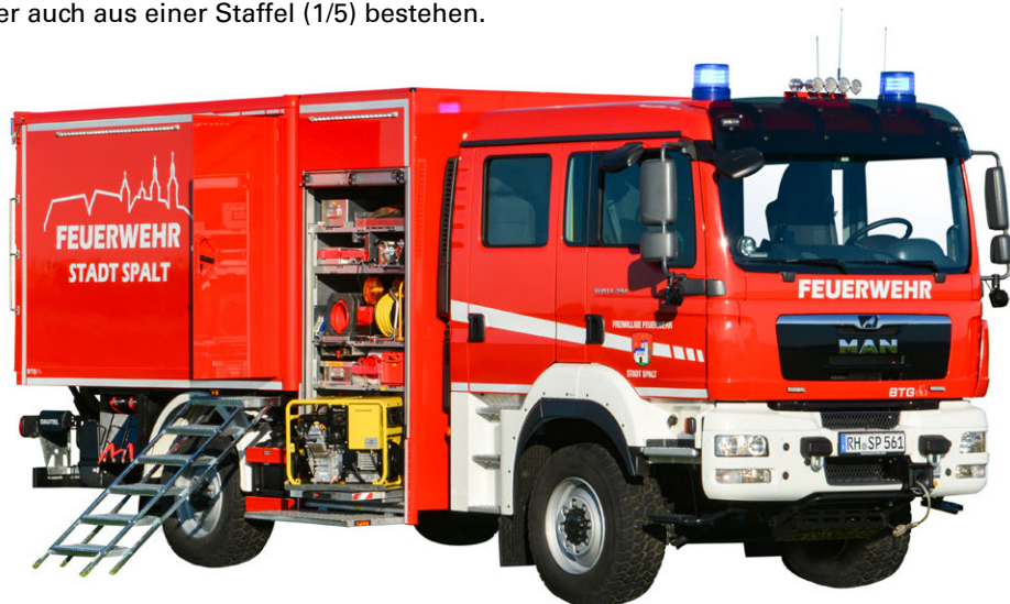
Abb. 19 GW-L2