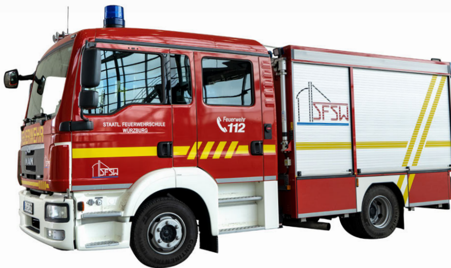
Abb. 5 MLF