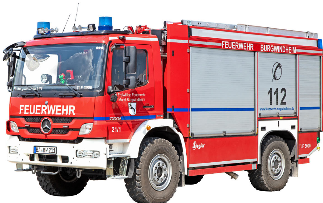
Abb. 6 TLF 3000