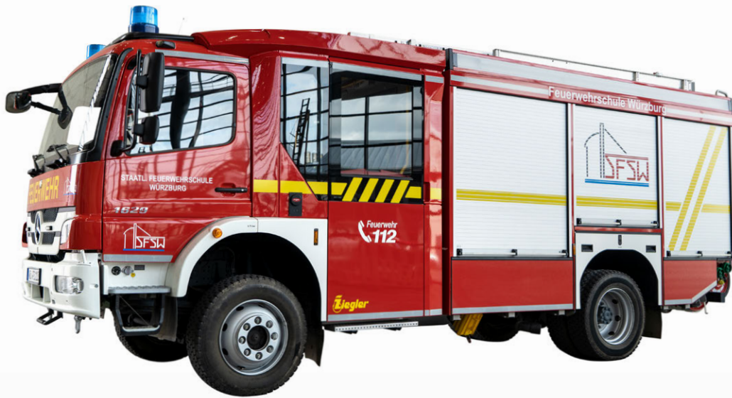
Abb. 3 HLF 20