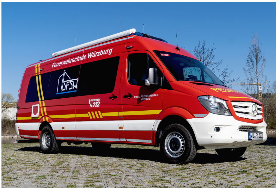
Abb. 16 ELW als UG-ÖEL