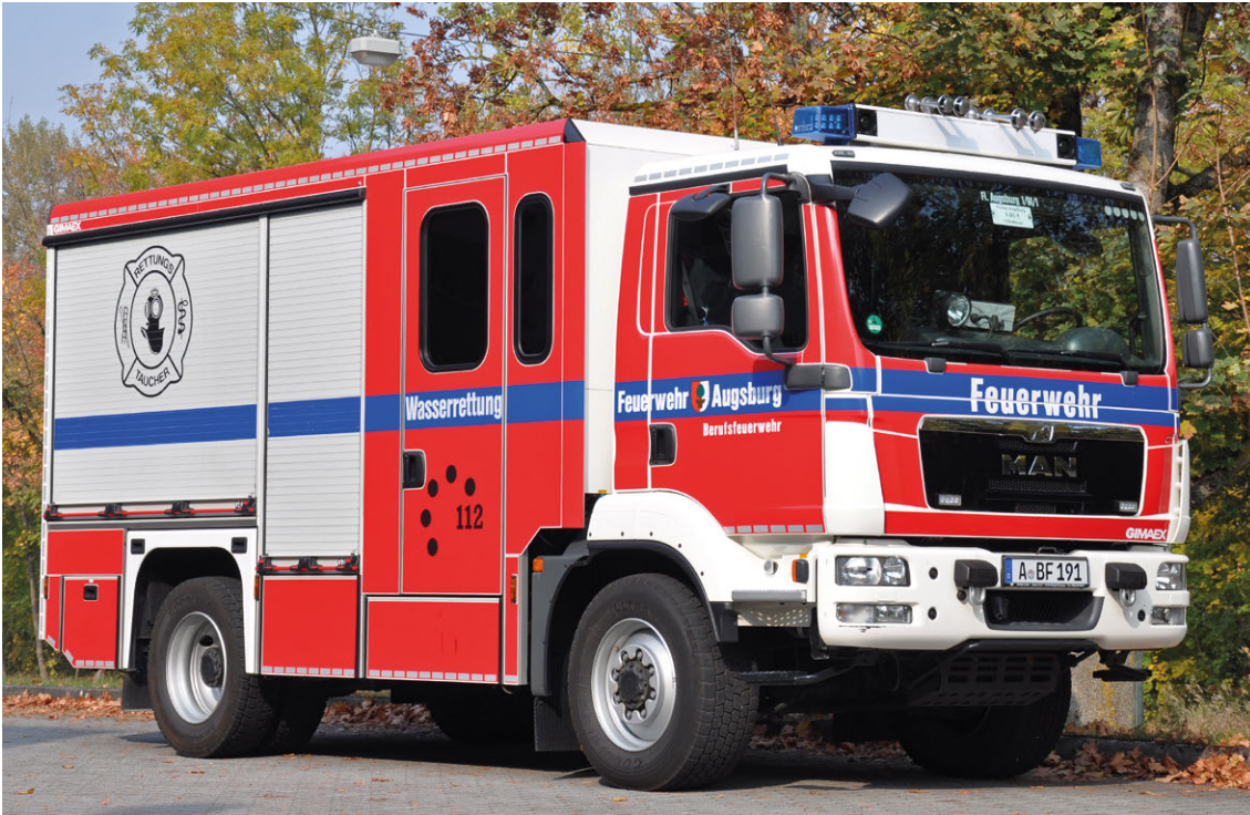
Abb. 11 GW-W