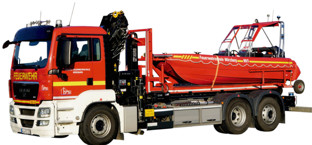
Abb. 18 WLF lang