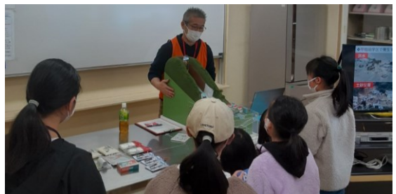
土石流模型実験装置と防災クイズで備えを学ぶ