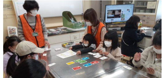
小学生と防災士がカードゲームで学習