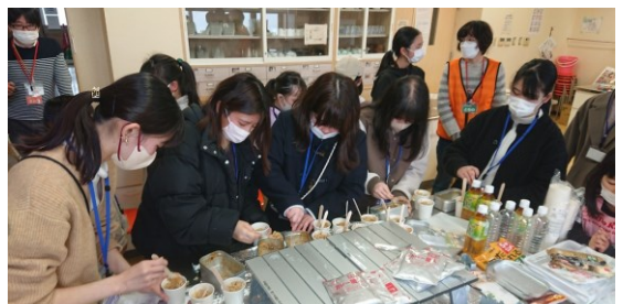
学生ボランティアによるメスティンカレーの配膳