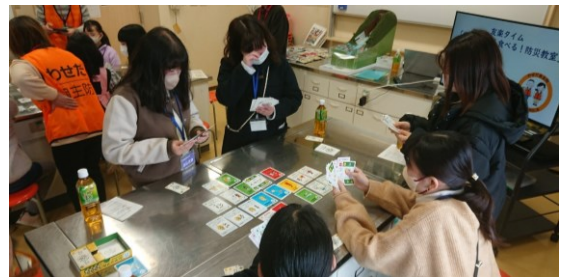
学生ボランティアもカードゲームをプレイ