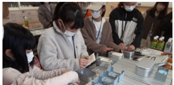
メスティンに無洗米と水を入れる小学生