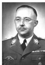
Heinrich Himmler (1900-1945)

Combattant en France pendant la Première Guerre mondiale, il adhère au parti démocrate puis est élu sénateur en 1934. Élu vice-Président de Roosevelt en 1944, il lui succède à sa mort. Président de 1945 à 1953, il lance deux bombes atomiques sur le Japon.