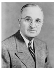
Harry Truman (1884-1972)

Combattant en France pendant la Première Guerre mondiale, il adhère au parti démocrate puis est élu sénateur en 1934. Élu vice-Président de Roosevelt en 1944, il lui succède à sa mort. Président de 1945 à 1953, il lance deux bombes atomiques sur le Japon.