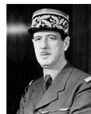
Charles de Gaulle (1890-1970)

Officier perçu comme le vainqueur de la bataille de Verdun en 1916, il est appelé à la tête du gouvernement en mai 1940, après l'invasion allemande, il propose l'armistice puis la collaboration. Chef de l'État français de 1940 à 1944, il est jugé en 1945.