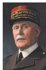
Philippe Pétain (1856-1951)

Entré au Parti nazi dès 1923, il devient le chef de la SS en 1929 et de la Gestapo en 1934. Il est le principal responsable de l'administration du système concentrationnaire puis de la Solution finale. Il se suicide en 1945 après son arrestation par les britanniques.