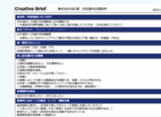
クリエイティブ・ブリーフ

目的・成果・ターゲットを共有し同じ目標に向かって、目的を達成するためのシートを作成します。初回打ち合わせ時に作成し、クリエイティブスタッフ全員がプロジェクト推進における指針としていきます。