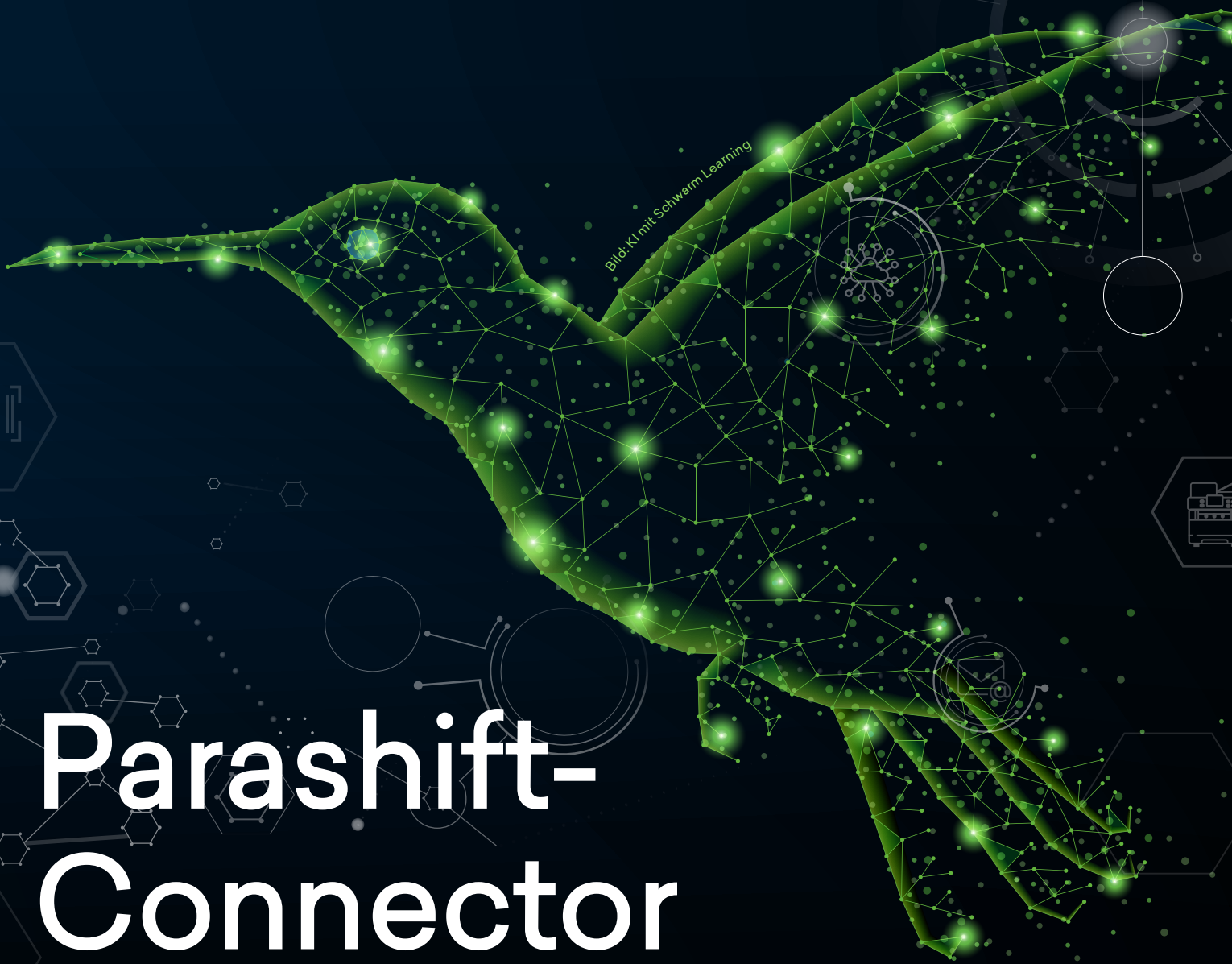
Bild: KI mit Schwarm Learning