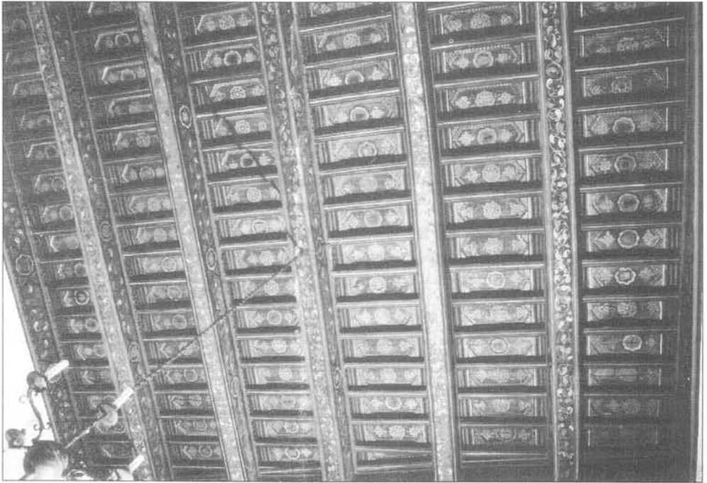
Fig. 1 Alfarje. Casa de los Señores de El Carpio.