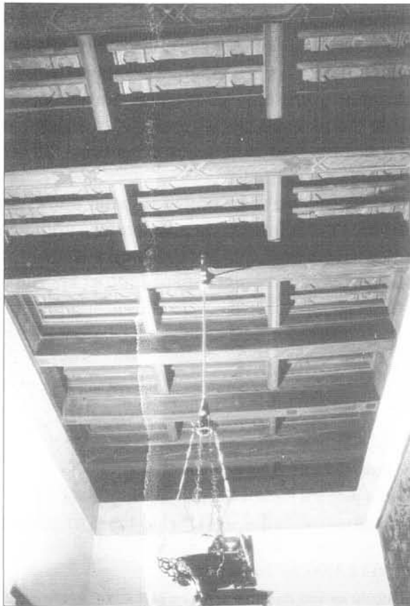
Fig. 2 Alfarje. Casa de los Señores de El Carpio.