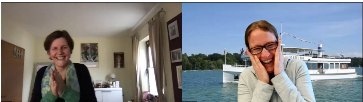
Lachübung "Schlange stehen"

Zwei Ebenen gibt es auf dem Schiff – geplant sind auf diesen Ebenen ca. 6 Stationen der Freude mit verschiedenen Angeboten. Lachyoga ist der Hauptaspekt, außerdem gibt es aktuell schon Körperpercussion, Singen und Tanzen. Ein Clown ist auch mit dabei und wird sich der Kinder annehmen. Familien mit Kindern sind herzlich willkommen auf dem Schiff!