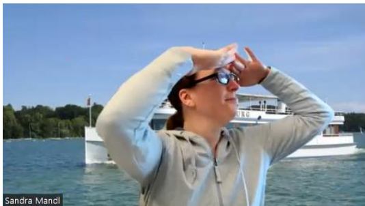
Schiff Ahoi ...