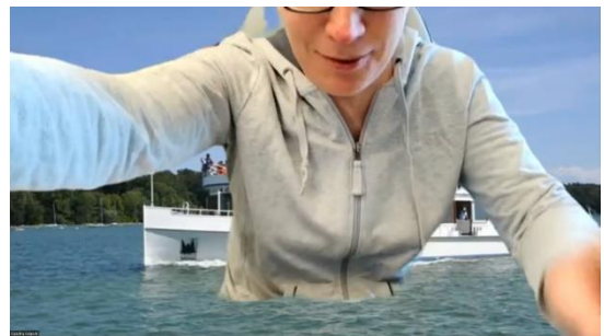
... und versinkt im Wasser