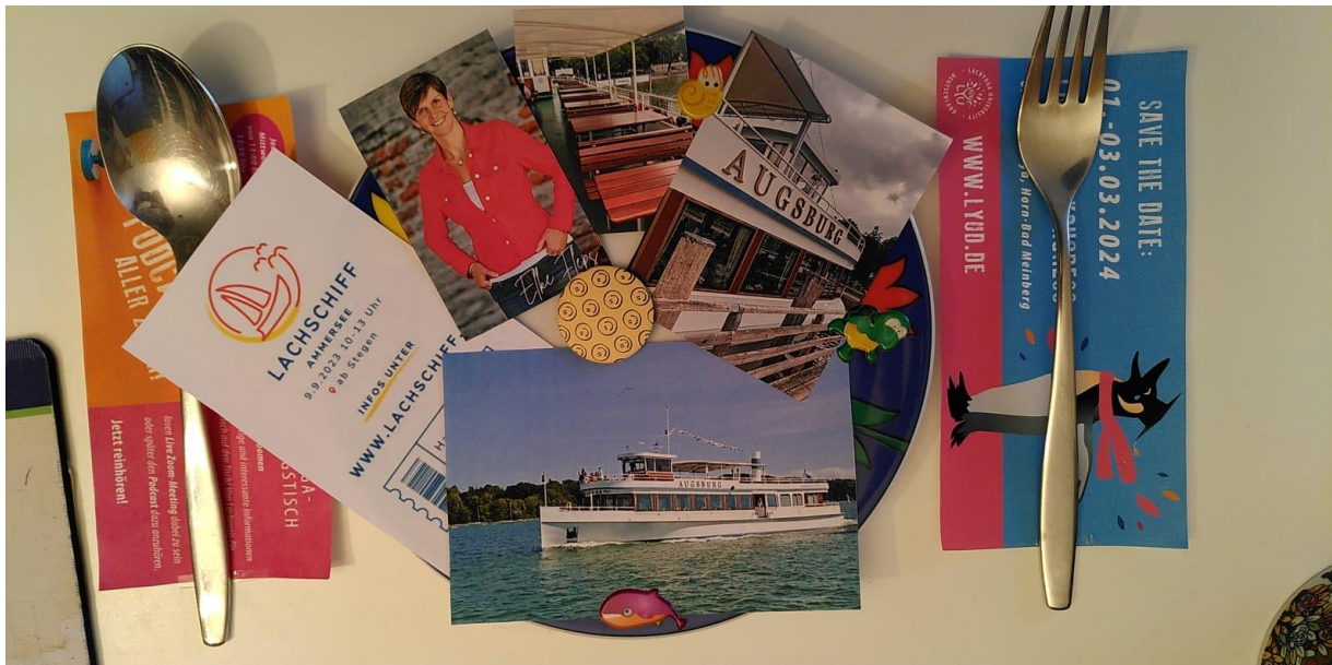
Lachyoga-Mittagstisch Teller „Happy Ahoi“