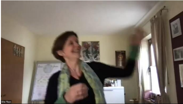
Lachübung: Wir holen alle mit ins Boot!