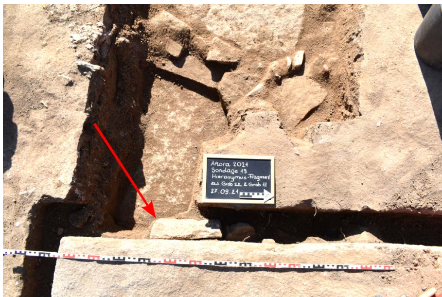
Fig. 4. «La Losilla», basílica. Excavación del área de contacto de las sepulturas n.º 11 y 22 con el duodécimo fragmento de la inscripción funeraria de Hieronimus apoyado a la pared occidental de la sepultura n.º 11 (marcado con la flecha); más al Oeste, las losas de cubierto de la sepultura n.º 22 ya parcialmente desenterradas.

sis, se puede deducir que el último enterramiento en la sepultura núm. 11 tuvo lugar en un momento posterior a 646 d.C., año de la muerte de Hieronimus 26 .