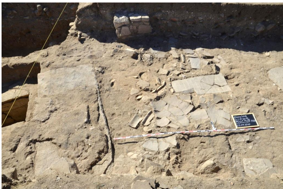
Fig. 3. «La Losilla», basílica. Parte medio de la nave central con la sepultura n.º 11 (a la izquierda, con orientación Norte-Sur) y la inscripción funeraria de Hieronimus todavía in situ (a la derecha, por encima de la sepultura n.º 22); al Sur del epitafio, los fragmentos de un recipiente de almacenamiento.

de alto, hasta 36 cm de ancho y hasta 3,2 cm de grueso 22 . Sus bordes están serrados, y su parte trasera está desbastada. La cara frontal está pulida, y las letras talladas en ella se conservan bien —aparentemente—, la losa no fue pisada durante un período prolongado, quizás por haberse instalado en un momento tardío de la utilización de la iglesia, o quizás por haber estado tapada 23 .