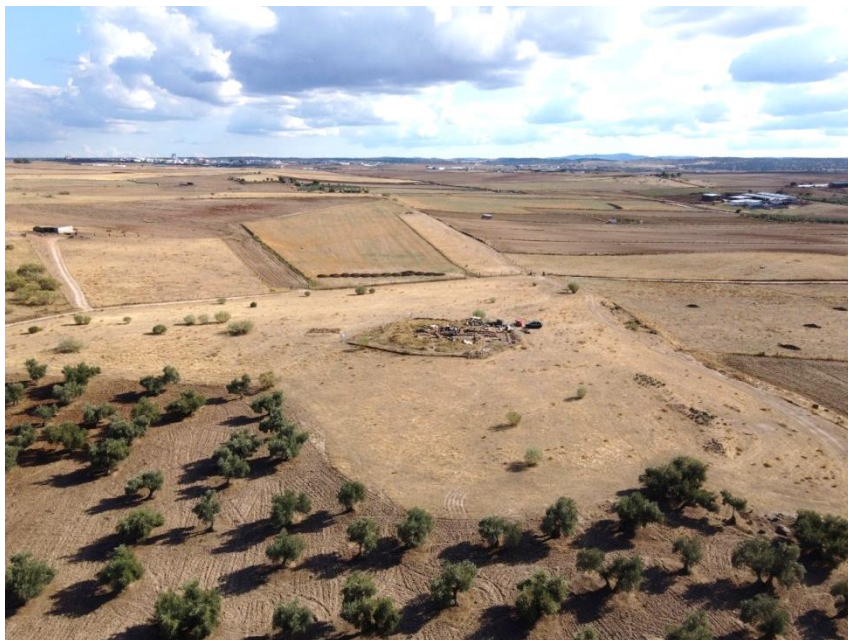
Fig. 1. Yacimiento de «La Losilla», en el término municipal de Añora (Córdoba). Vista aérea hacia Sur.

En cuanto a la iglesia, se trata de una basílica de tres naves, un ábside oriental y estancias adicionales anejas a ambos lados de las naves. Tanto las naves como los citados espacios anejos están completamente ocupados por sepulturas (Fig. 2), y también fuera del edificio, al menos al lado Norte, la necrópolis se extiende hasta unos 15 m de distancia 13 . Los hallazgos arqueológicos indican una ocupación del asentamiento entre la segunda mitad del siglo VI y mediados del VIII 14 . No hay evidencias ni de una fase precedente, todavía de época romana 15 , ni tampoco de una perduración