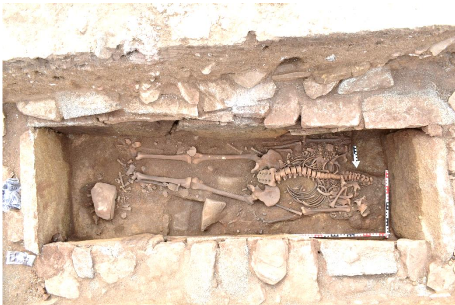
Fig. 5. «La Losilla», basílica. Excavación de la sepultura n.º 22 con los esqueletos de Hieronimus y de la niña in situ.

al lado Sur del esqueleto de Hieronimus (Fig. 6). La superposición de algunas costillas de la niña a las del varón demuestra que se había colocado el cadáver de la niña sobre la parte superior del adulto, en un momento contemporáneo o posterior. Sin embargo, el hecho de que los fémures y una tibia de la niña se encontraban por debajo de la mitad derecha de la pelvis y del fémur derecho de Hieronimus refleja que ambos individuos fueron enterrados en el mismo momento— la superposición de los huesos del varón por encima de los de la niña debe haber ocurrido con posterioridad, a lo largo del proceso de descomposición.