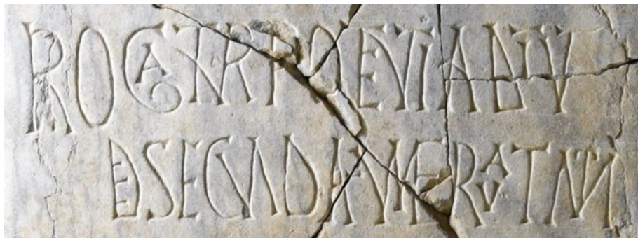
Fig. 8. Córdoba, Museo Arqueológico y Etnológico Provincial. Inscripción funeraria de Hieronimus procedente de la basílica de «La Losilla», detalle de las líneas 3 y 4.