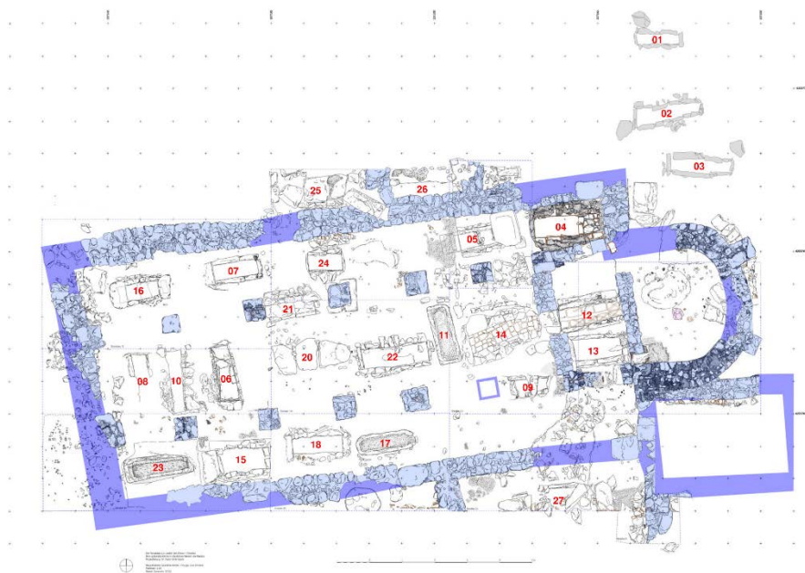
Fig. 2. «La Losilla», basílica. Plano con reconstrucción esquemática e indicación de las sepulturas (dibujo H. Bücherl – Fr. v. Droste).

hasta época medieval del asentamiento 16 : parece que fue fundado ex novo en época visigoda y abandonado en el siglo VIII, quizás no mucho después de la invasión árabe en 711 17 .