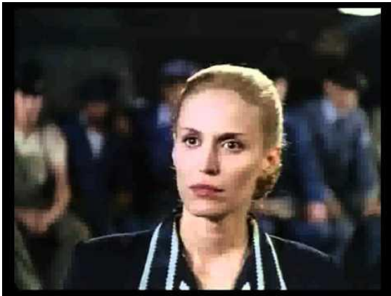
Escena película Eva Perón: Eva le habla a los ferroviarios

https://www.youtube.com/watch?v=0ZRK0f5GJRc