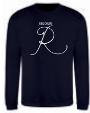
new french navy