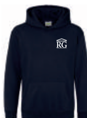
new french navy