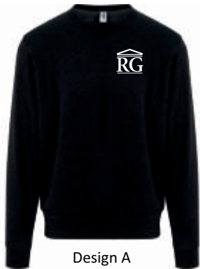
Design A 39,00 €