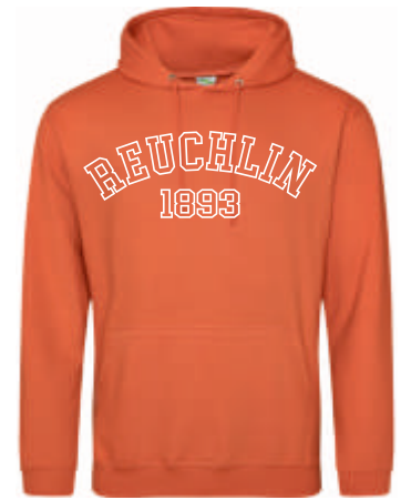
Design C 48,00 €

MEINE BESTELLNUMMER JH001 DU KANNST MICH BESTELLEN IN XS - 3XL