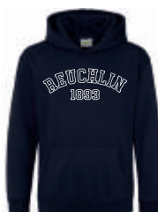
new french navy