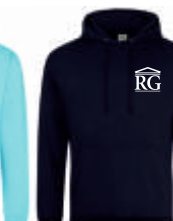
new french navy