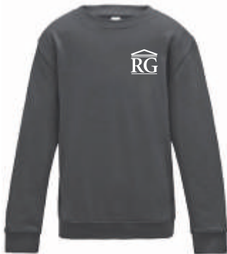
Design A 37,00 €