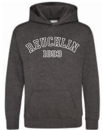
Design C 46,00 €