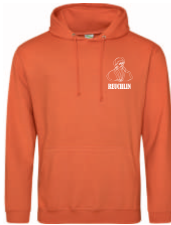
Design B 42,00 €