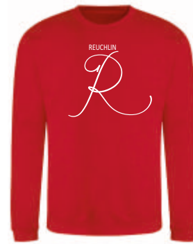
Design C 43,00 €