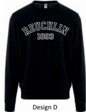
Design D 43,00 €

MEINE BESTELLNUMMER JH030 DU KANNST MICH BESTELLEN IN XS - 5XL