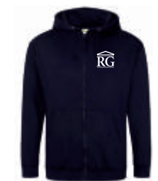
new french navy