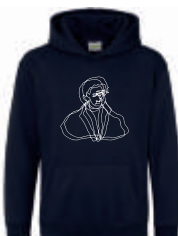
new french navy