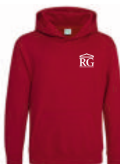
red hot chilli