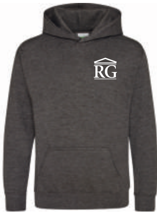
Design A 41,00 €