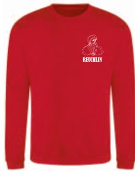
Design B 39,00 €