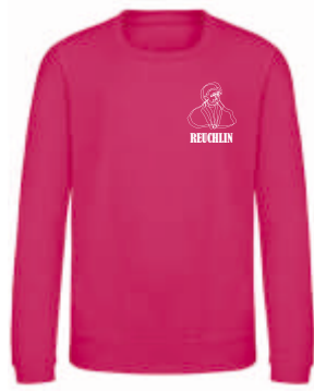
Design B 37,00 €