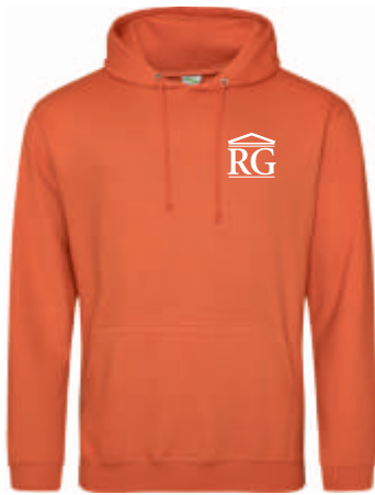
Design A 42,00 €