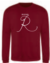
red hot chilli