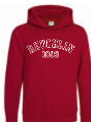
red hot chilli