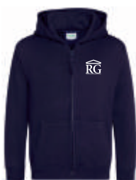
new french navy