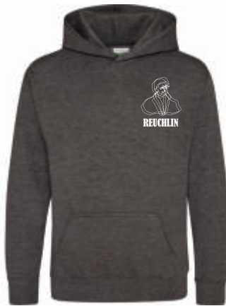
Design B 41,00 €