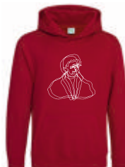
red hot chilli