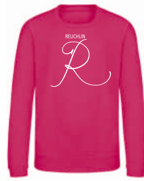
Design C 41,00 €