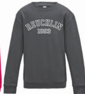
Design D 41,00 €