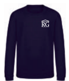
new french navy