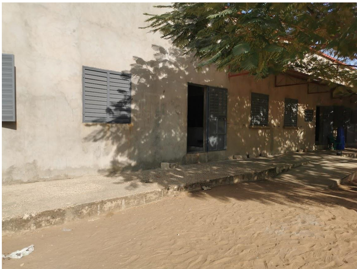
Ecole primaire après peinture des ouvertures métalliques