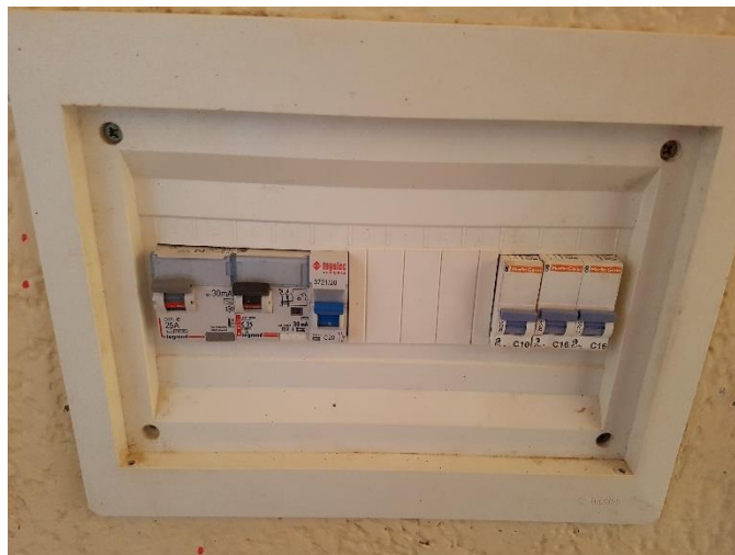
Tableau électrique du complexe polyvalent avant et après réparation nécessitant l'intervention d'un ouvrier de la Sénélec pour installer un coupe circuit inexistant sous le compteur extérieur.