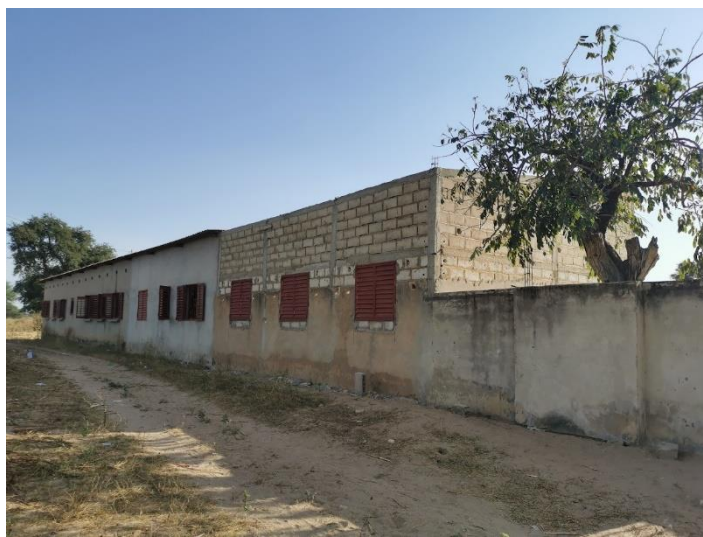
La nouvelle classe en construction côté cour et côté rue