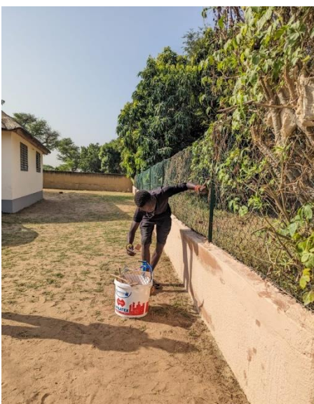
Peinture du sous bassement du mur de clôture grillagé du complexe polyvalent