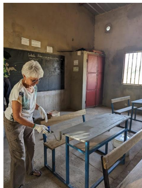
peinture des nouvelles tables-bancs