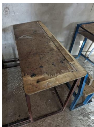
Table banc en partie détériorée