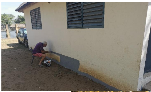
Travaux de peinture