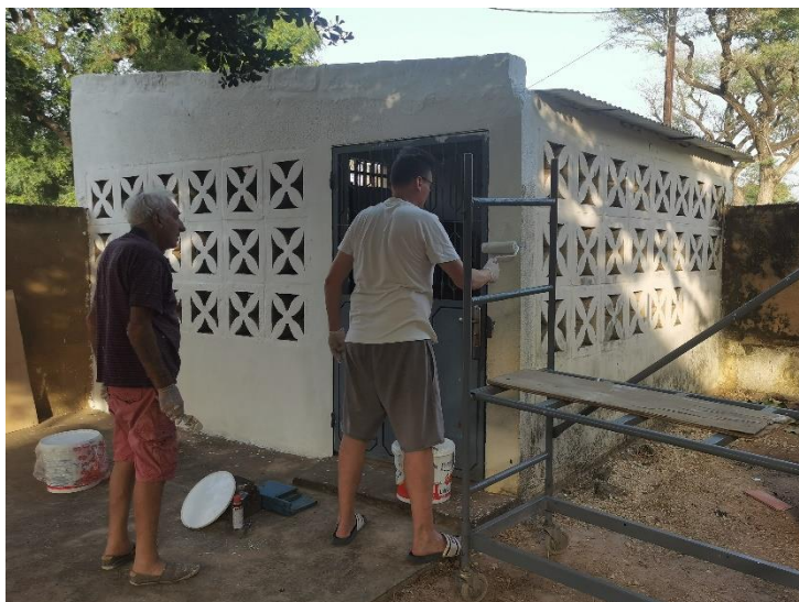
Peinture murs de la cuisine