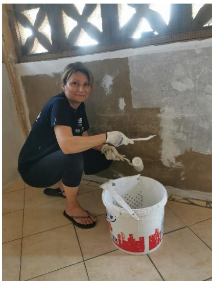
Peinture classe maternelle