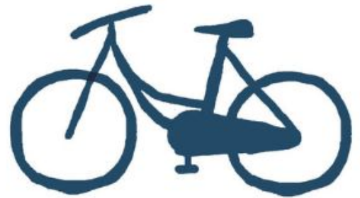
Un nouveau vélo