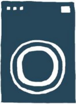
Une machine à laver