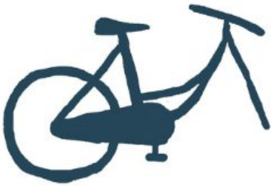
Un vélo sans roue