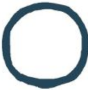
Le hublot de la machine à laver