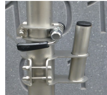
Vorrichtung zur Aufnahme eines Sattel-Stützen-Gepäckträgers