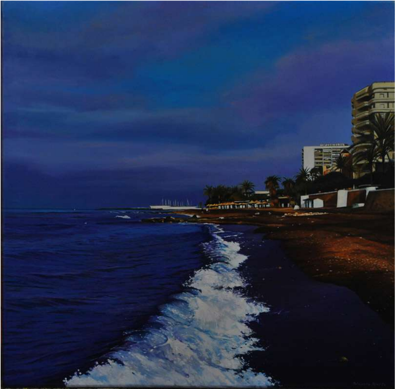
Playa de la Bajadilla. Óleo/lienzo. 50 X 50 cm.