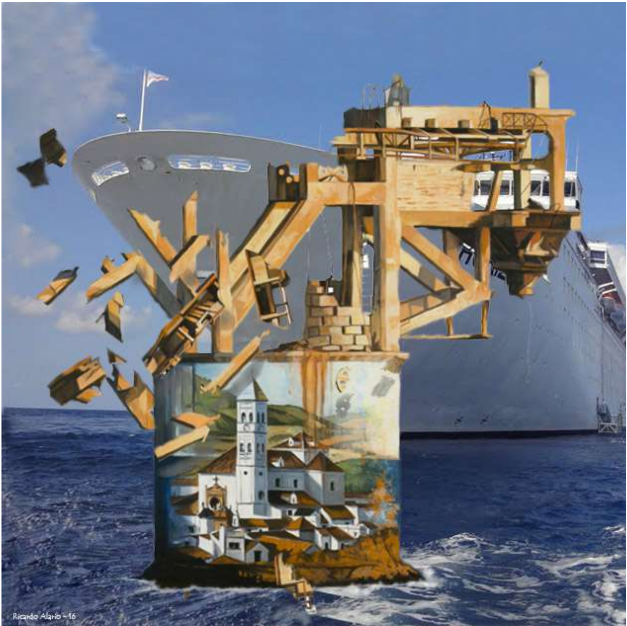
Ricardo Alario. ¡Y llegaron los transatlánticos! Composición digital.