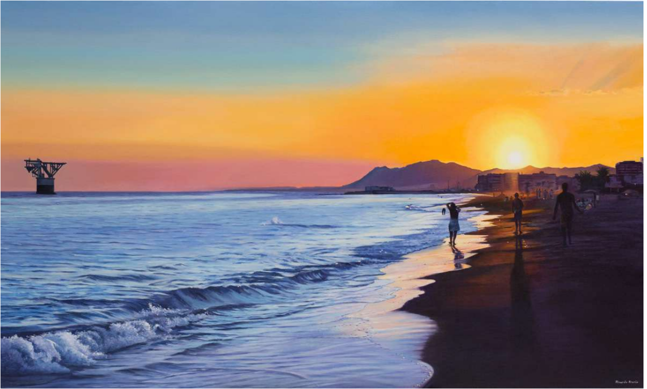
Atardecer en la playa del Cable, Marbella . Óleo/lienzo. 100 X 160 cm.