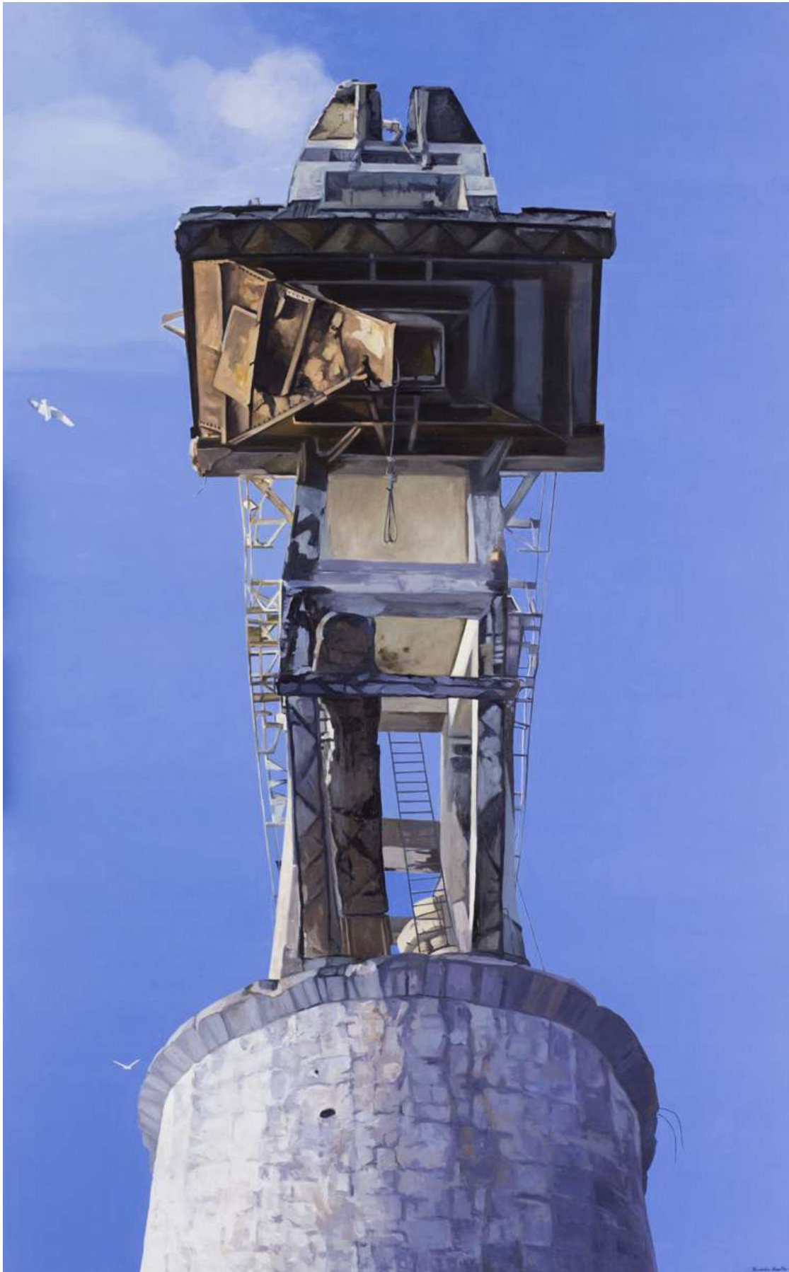
Cubeta de descarga de mineral a la cinta transportadora que vertía en las bodegas de los barcos. Óleo/lienzo. 200 X 130 cm.