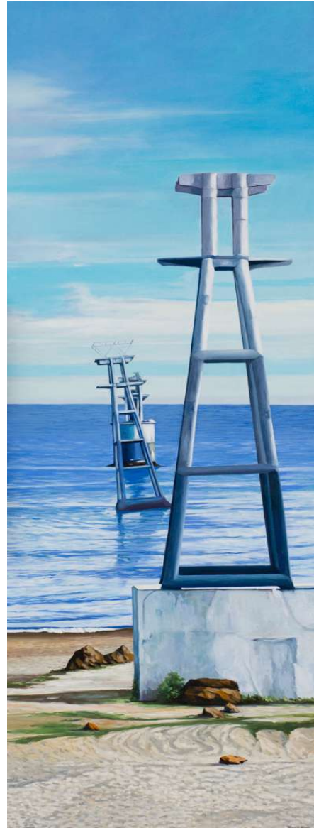
Las torretas I y II. Óleo/lienzo. 190 X 60 cm.