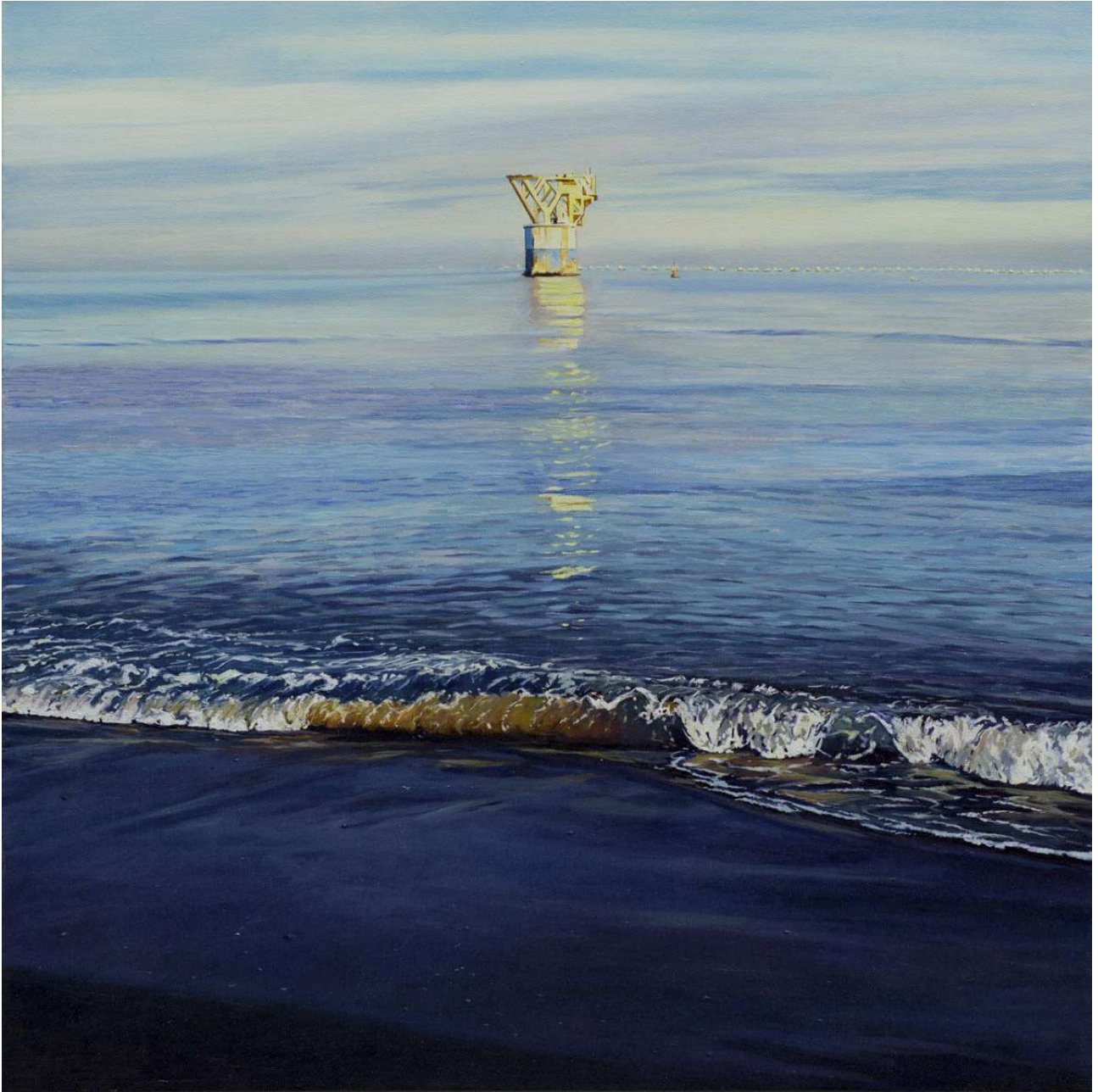
Vista de la Torre desde la playa del Cable al atardecer Óleo/lienzo. 70 X 70 cm.