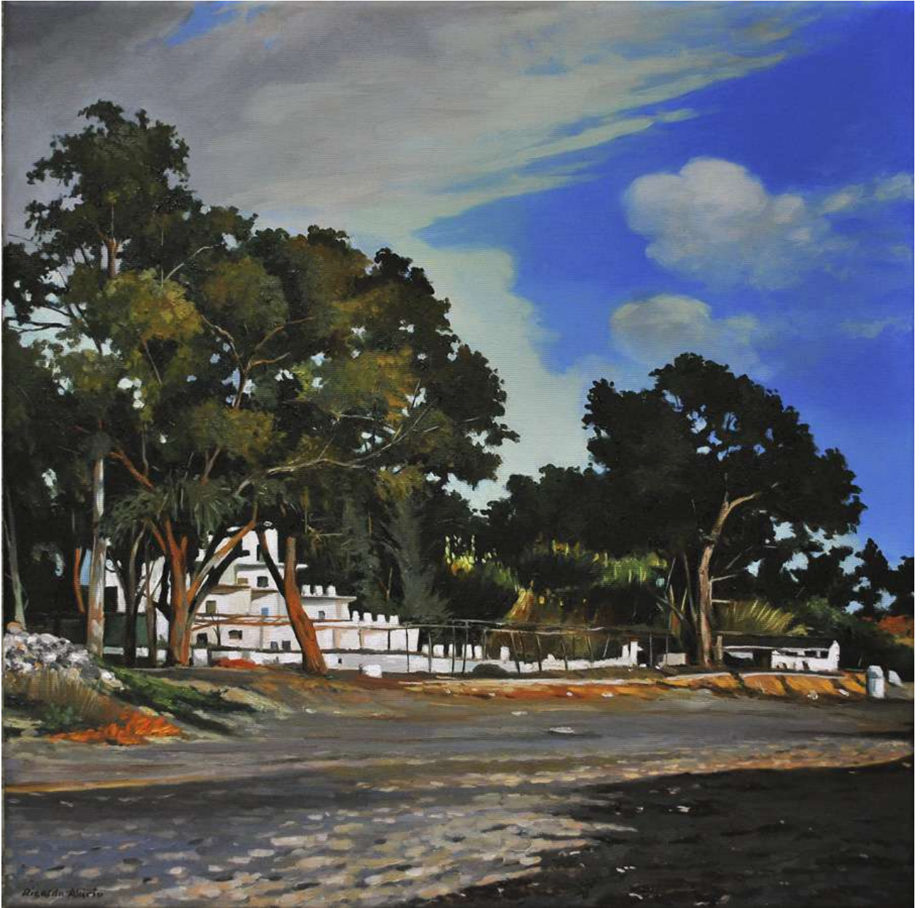
Caomping de Marbella Óleo/lienzo. 50 X 50 cm.