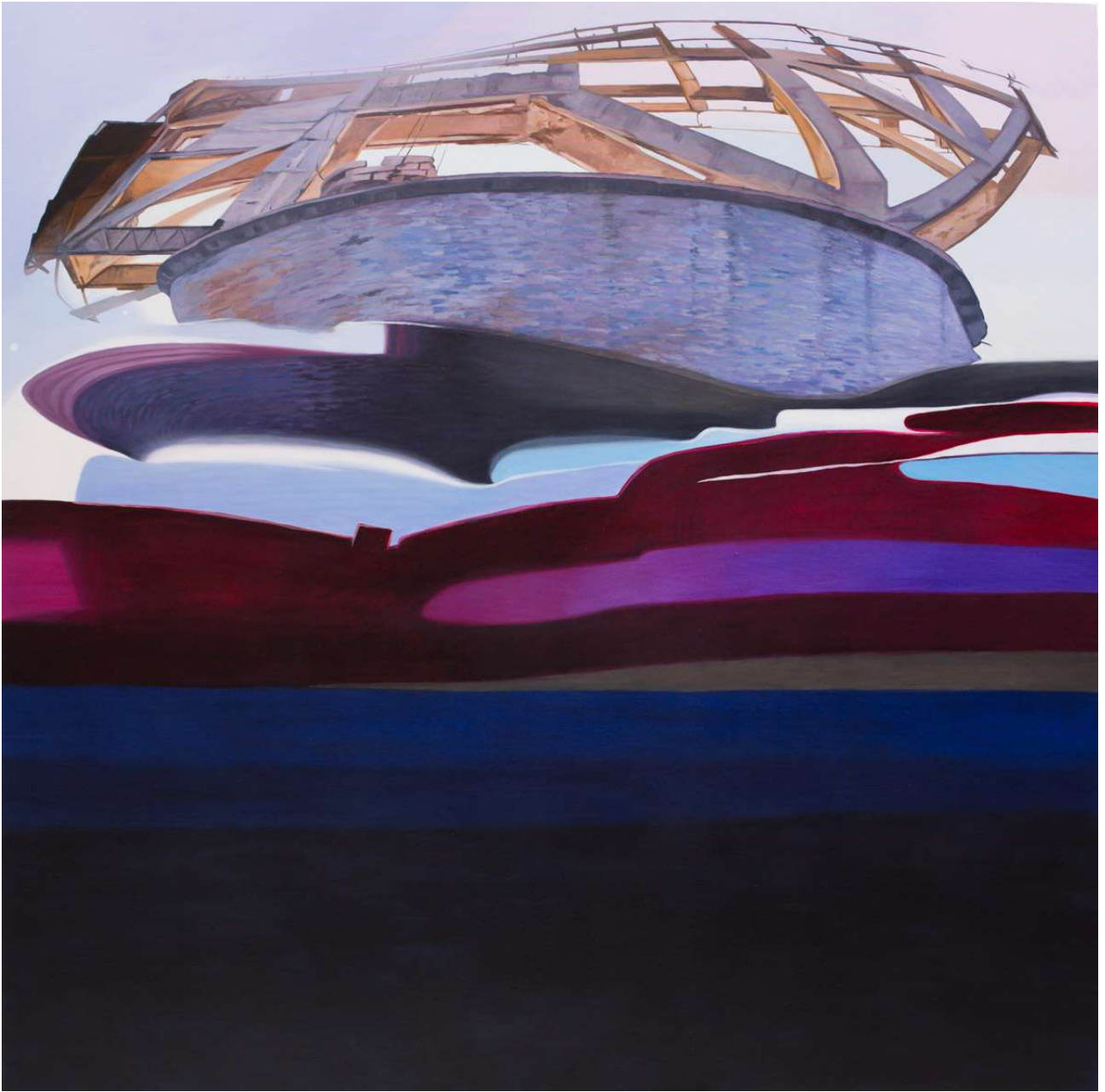
Vista acuática de la Torre de Carga de mineral Óleo/lienzo. 190 X 190 cm.