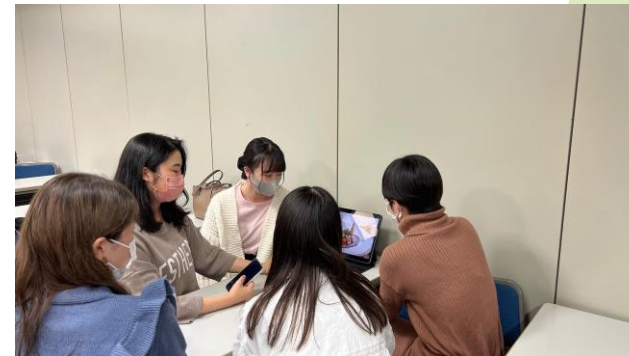
カフェ本編集会議の様子