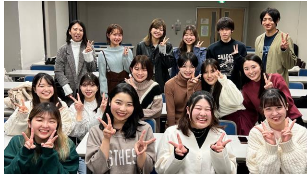
カフェ本編集会議