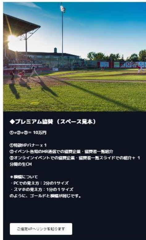
広告サンプルページ_プレミアム協賛

URL : https://www.mr60.net/%E5%BF%9C%E6%8F%B4%E3%81%AE%E3%81%8A%E9%A1%98%E3%81%84/