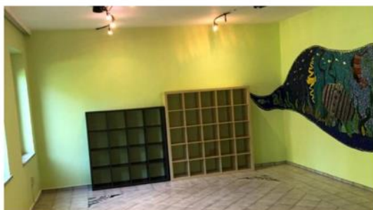
Der Rückzugsraum der Mittelschule Baden im neuen Styling.