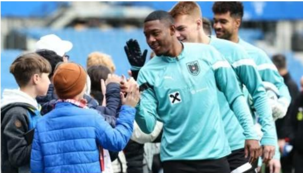
Kapitän David Alaba und Co. klatschten mit den Kindern ab.