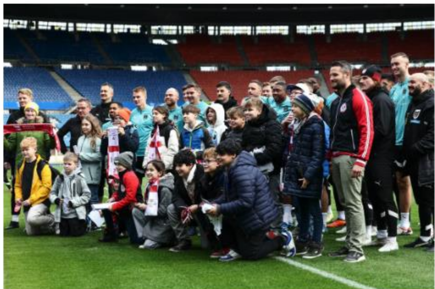
Die Schülerinnen und Schüler der Mittelschule Baden machten auch ein Erinnerungsfoto mit dem Nationalteam.