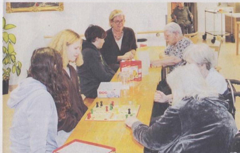
|| Bewohner und Schüler haben gleichermaßen Spaß.