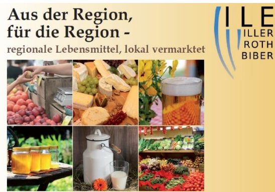
Regio-Broschüre „Aus der Region, für die Region“

Regional erzeugte Lebensmittel liegen im Trend. Aber oft bleibt noch die Frage, wo diese denn zu erwerben sind. Mit unserer Broschüre unter dem Motto „Aus der Region, für die Region“, welche Sie in Ihrer Gemeindeverwaltung und in einschlägigen Auslagestellen kostenfrei abholen können, schafft die ILE Iller-Roth-Biber eine Übersicht an Lebensmittelerzeugenden und -vermarktenden in der Region.