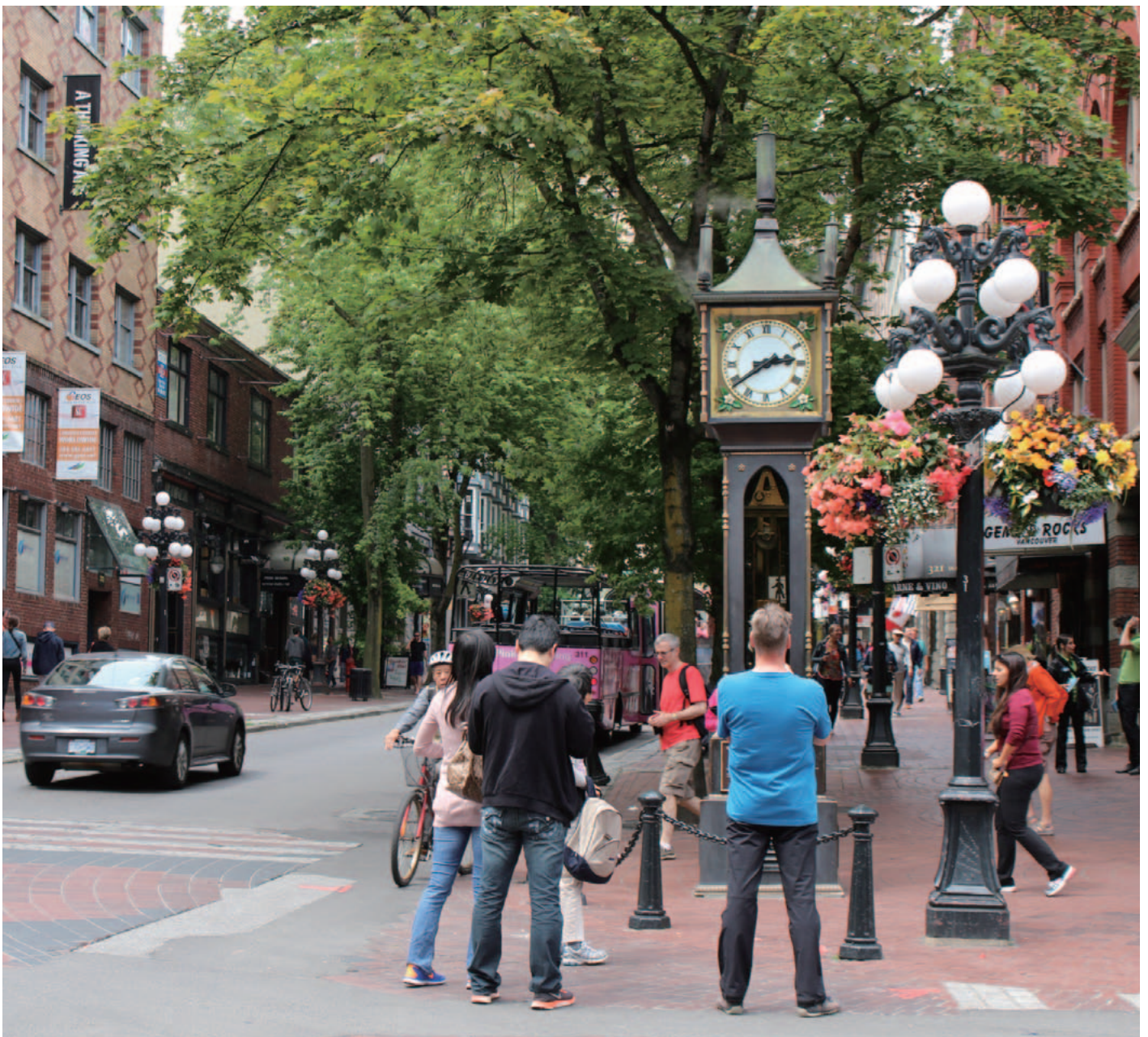
バンクーバー発祥の地ガスタウンのシンボル「蒸気時計」 "The Steam Clock"—Landmark in the Gastown area of Vancouver

ホームページ: https://www.hiroshima-canada.org/