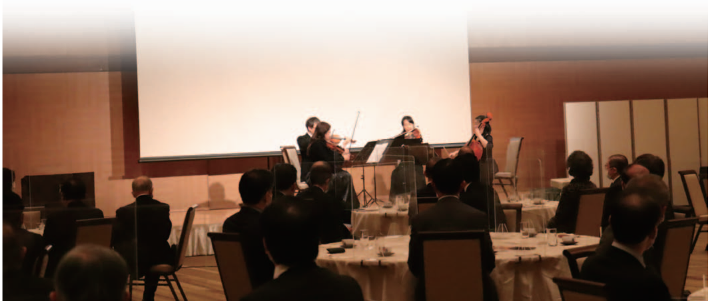
広島交響楽団による演奏 Performance by Hiroshima Symphony Orchestra

The highlight of the evening was a draw for gifts donated by members. The room was filled with the smiling faces of the winners as they received their gifts.