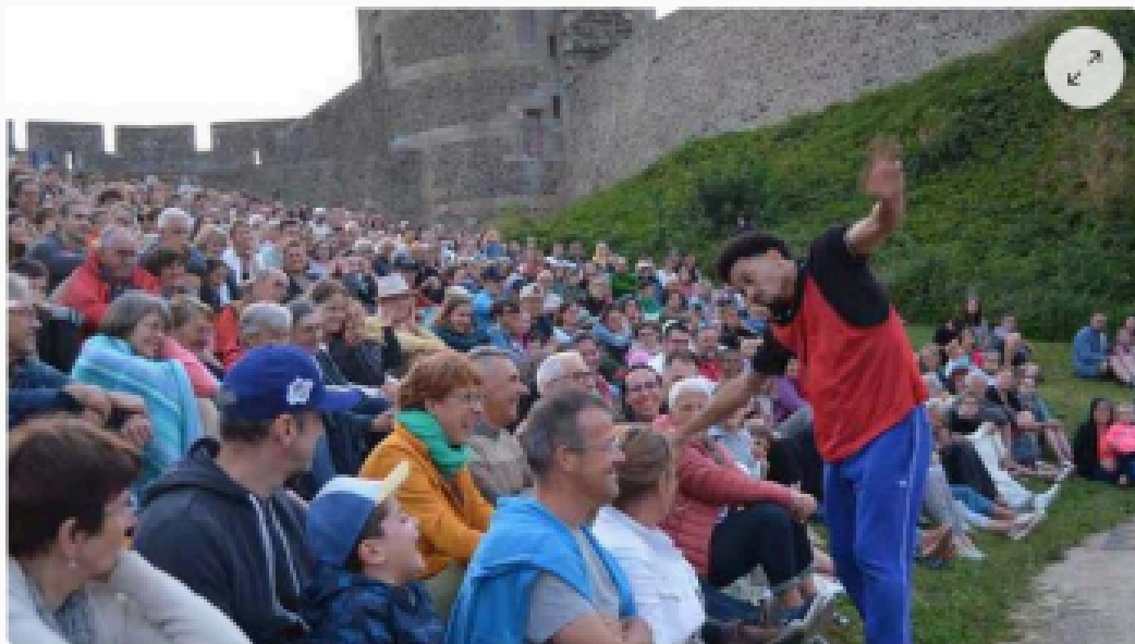
Un spectacle avec de belles interactions avec le public fougérois.

“Nous sommes transportés dans leurs joies, leurs doutes et blocages, leurs peurs, leurs victoires, et bien d'autres sentiments.”