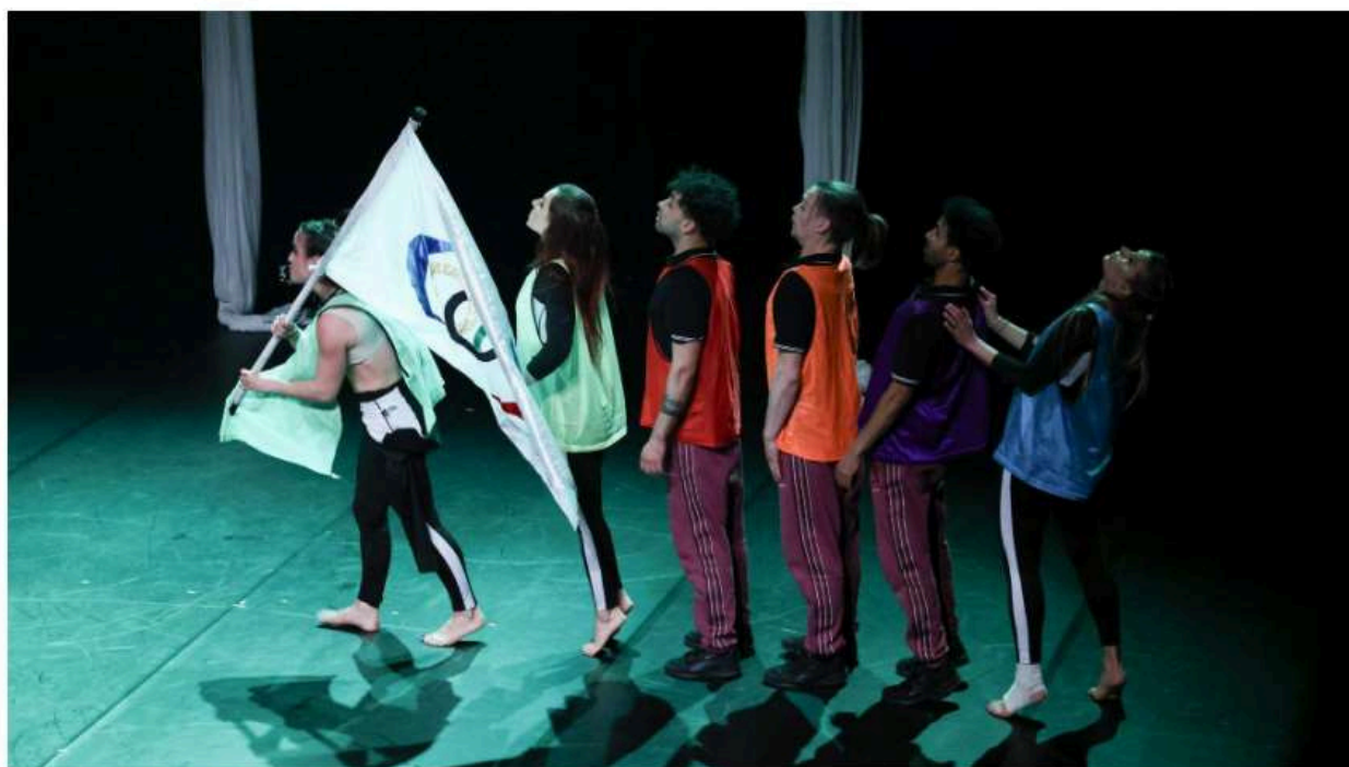
Un avant-goût des Jeux olympiques célébrés ce mercredi.

A cent jours de la cérémonie d'ouverture des Jeux de Paris, les valeurs de l'olympisme ont été transmises à travers un spectacle joué à l'abbaye de Neumünster.