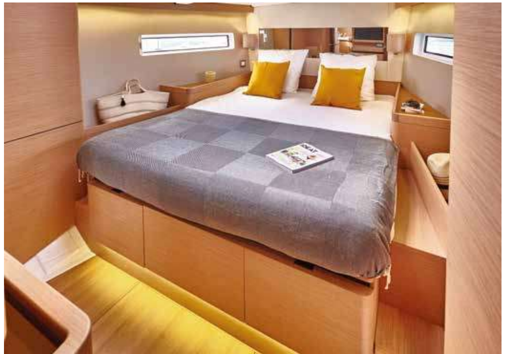
▲ High standard master cabin Cabine propriétaire de haut standing Eignerkabine mit hohem Standard Cabina propietario de alta gama Lussuosa cabina armatoriale