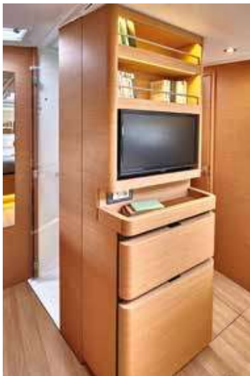
▲ Many spaces of storage and a private head Nombreux rangements et une salle de bain privative Viel verfügbarer Stauraum und ein Privates Waschräume Muchos espacio de almacenaje disponible y un privato baño Molteplici scomparti e armadietti e uno privato bagne