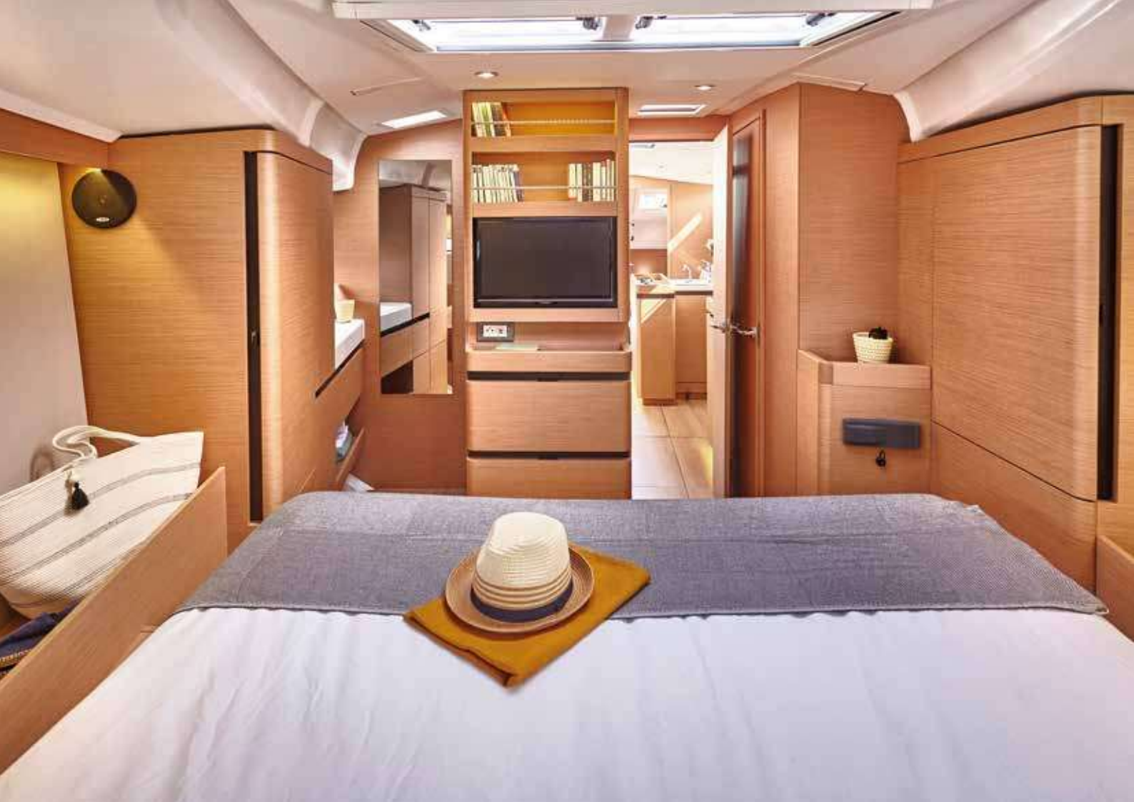
▲ Bright and voluminous master cabin Cabine propriétaire lumineuse et volumineuse Helle und großzügige Eignerkabine Cabina propietario luminosa y espaciosa Cabina armatoriale luminosa e con bei volumi