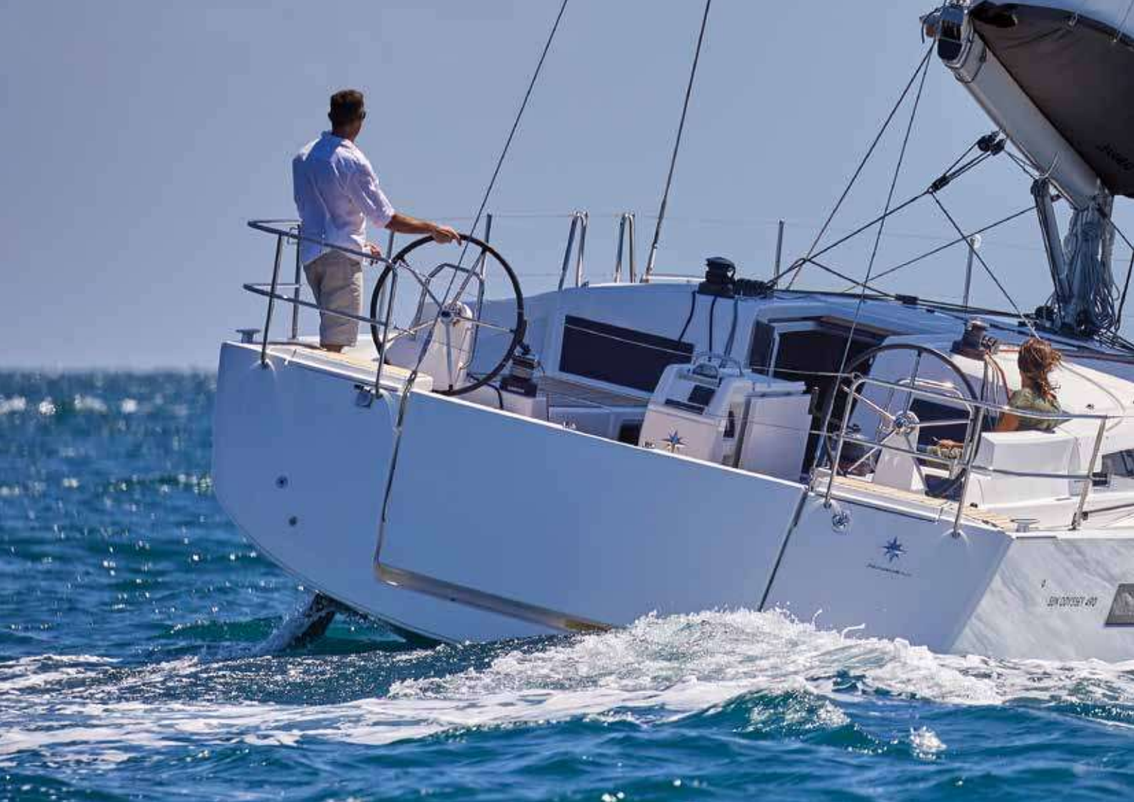
► Comfortable and functional cockpit Cockpit confortable et fonctionnel Komfortables und funktionelles Cockpit Carlinga confortevole e funzionale Cómodo y funcional pozzetto