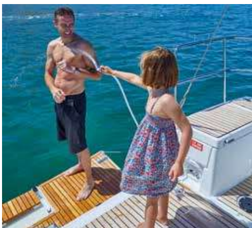
► Cockpit with a wide swim platform Cockpit avec large plateforme de bain Cockpit mit großer Badeplattform Cockpit con gran piattaforma de baño Pozzetto con grande piattaforma di poppa