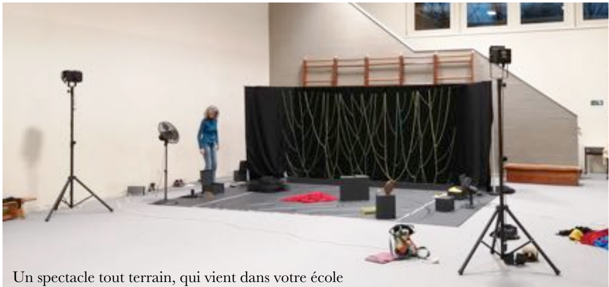
Un spectacle tout terrain, qui vient dans votre école