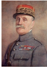
Ferdinand Foch (1851-1929)

Général retraité, il est rappelé en 1914 par l'empereur Guillaume II lors de l'entrée des Russes en Prusse Orientale. Il bat les Russes à Tannenberg puis devient Chef de l'État-Major et est nommé Maréchal en 1916. Avec Ludendorff, il impose une dictature militaire.