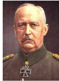
Erich Ludendorff (1865-1937)

Général français, il combat sur la Marne en 1914 puis dans le Nord de la France à partir de 1915. En 1918, il est nommé commandant en chef des forces alliées et mène la contre-offensive qui permet la victoire de l'Entente. Il est élevé au rang de Maréchal de France.