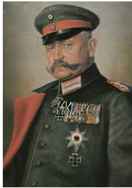
Paul von Hindenburg (1847-1934)

Général français, commandant en chef des armées jusqu'en 1916, il permet la victoire de la bataille de la Marne sur les Allemands en 1914. À la suite de cette victoire, il est élevé au rang de Maréchal de France et il presse les États-Unis d'entrer en guerre en avril 1917.