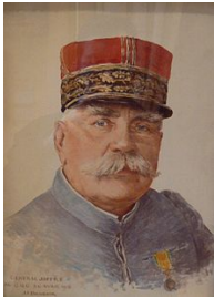
Joseph Joffre (1853-1931)

Général français, commandant en chef des armées jusqu'en 1916, il permet la victoire de la bataille de la Marne sur les Allemands en 1914. À la suite de cette victoire, il est élevé au rang de Maréchal de France et il presse les États-Unis d'entrer en guerre en avril 1917.