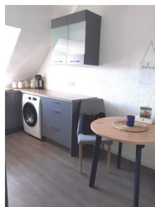
Küche Bild 1