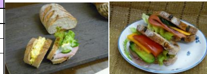
ソフトライ麦、プレーン ソフトライ麦 生くるみレーズン