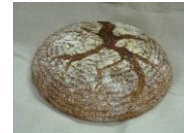
ライ麦60、しっとりライ麦(プレーン)