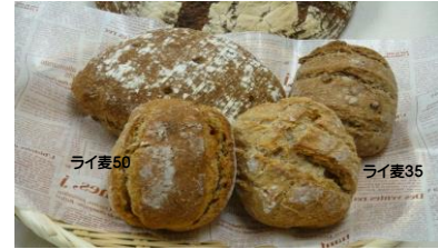
ライ麦パン各種: ライ麦35、ライ麦50

■ライ麦パンは、カレンスで酵母を起し、オーガニックライ麦と東北の小麦'ゆきちから'を使い高温で焼いています。そのため表面が堅くなりますが、中は大きく焼くほどもちり、ふんわりになります。ライ麦のさわやかな酸味、芳香を楽しむために、チーズ類などを塗ったり、生ハム、ソーセージをのせカナッペやサンドイッチにしてお召上がり