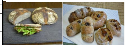
カンパニー、プレーン くるみパン、くるみパンいちじく

■カンパニーは北海道小麦をベースに東北産ゆきちからと少量のライ麦を自家製酵母を使いじっくり発酵させ高温で焼きました。皮は厚めで香ばしく歯ごたえがあり、中はしっとりして酵母のほのかな酸味があります。国産小麦と自家製酵母の香りをお楽しみください。