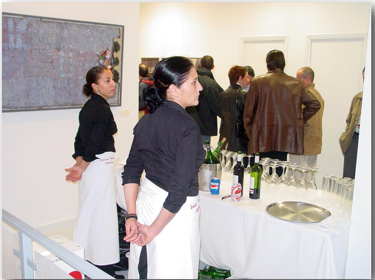
Panorámica del cocktail de inauguración.

Galería de Arte Contemporáneo. Bocana, Marbella. 2004 – 05.