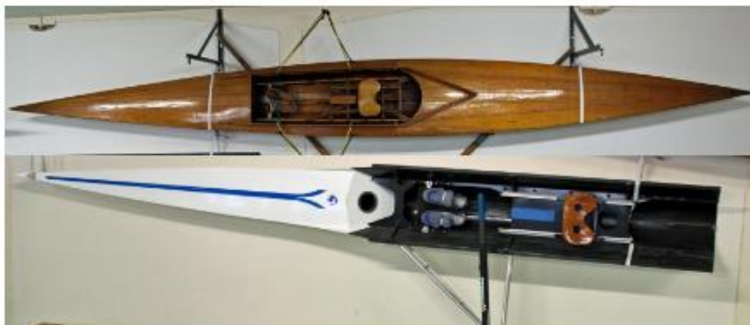
Deux modèles : l'un très ancien tout en bois et le second moderne en nid d'abeilles (musée des Régates)