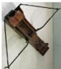
deux anciens modèles de rameurs