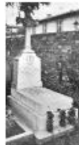
sa tombe à Saint-Brice