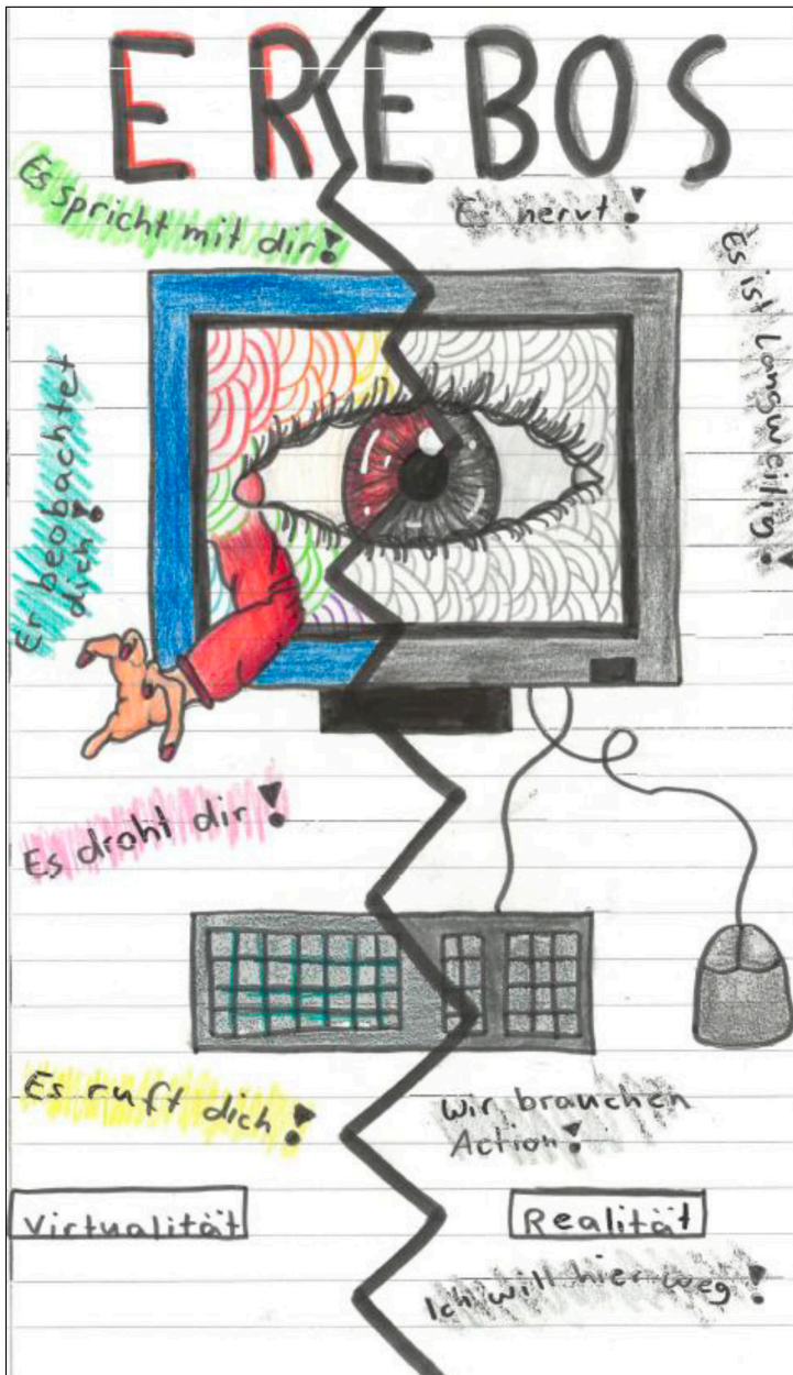
Darstellung der Handlungsebenen von Alexis