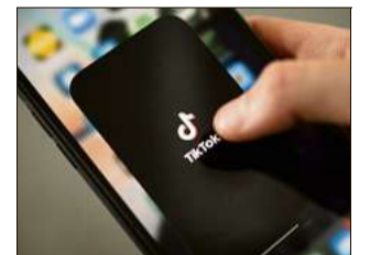
Tiktok ist eines der beliebtesten Sozialen Medien.

Bei WhatsApp sind Nachrichten von unbekanntem Nummern im Stil von »Hallo Mama, dies ist meine neue Nummer. Du kannst meine alte bitte löschen. Übrigens habe ich 2000 Euro Schulden. Könntest du mir das Geld bitte schnell auf das untenstehende Konto überweisen?« keine Seltenheit und führen oft zu finanziellen Schäden. Hier gilt es, sich zu schützen. Man sollte unbedingt den Wahrheitsgehalt solcher Nachrichten überprüfen.