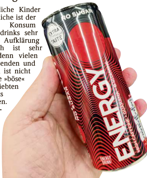
Energydrinks wie dieser sind bei Jugendlichen beliebt.

■ Die Autorin ist Schülerin der GWRS Villingendorf, Klasse 8.