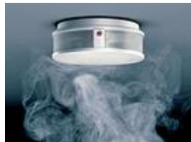
BRANDWARNANLAGEN VDE 0826