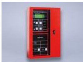
BRANDMELDEANLAGEN DIN14675 / 0833