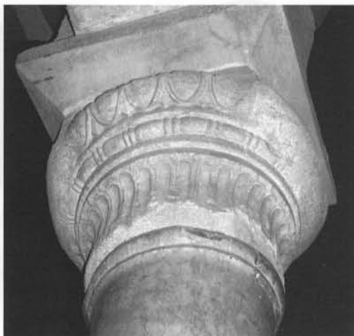
Capitel de estilo corintio asiático de la ampliación de 'Abd al-RaDmān II.