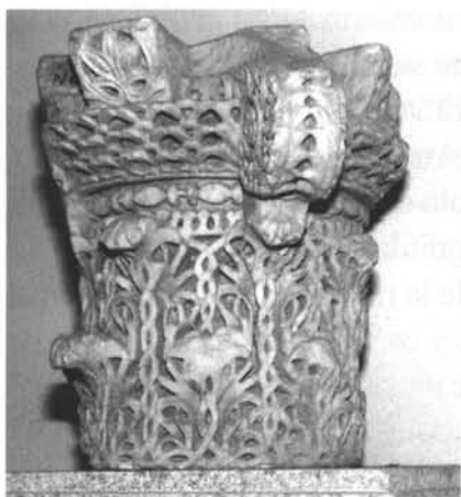
Capitel. Museo Arq. de Córdoba.