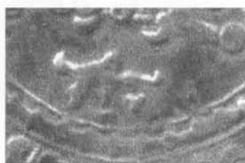
Detalle de un capitel del Museo Arq. de Córdoba y del dirham 336.31d