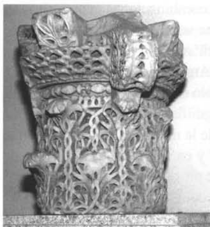
Capitel. Museo Arq. de Córdoba.