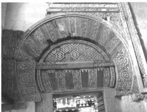
Portada Occidental. Ampliación de al-Hakam II.

Estos contarios en los que alternan óvalos y dos discos empezamos viéndolos en los capiteles romanos y visigodos del área de 'Abd al-RaDmān I y 'Abd al-RaDmān II. También se pueden enumerar muchos mas ejemplos y de esta forma los vemos en dos capiteles de la planta baja de la Capilla Real, en la ampliación de al-Cakam II aparece en el arco de la fachada del miDrāb , en el interior del mihrab lo vemos debajo de la imposta de mármol apeada en modillones “un contario de posible ascendencia bizantina” (M. Nieto Cumplido, La Catedral de Córdoba , p. 229).