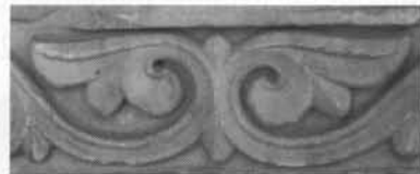
DIRHAMES Y DETALLE DE BASA DEL MUSEO ARQ. DE CÓRDOBA