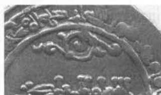
Detalle del mosaico del miDrāb de la mezquita de Córdoba y del dirham 337.139d