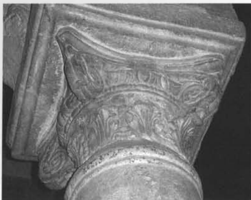
Capitel romano de la nave de 'Abd al-RaDmān I.