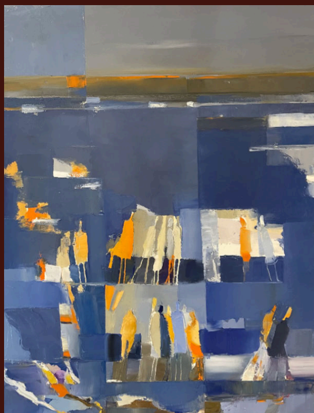
Marée basse Huile sur toile 92 x 73 cm