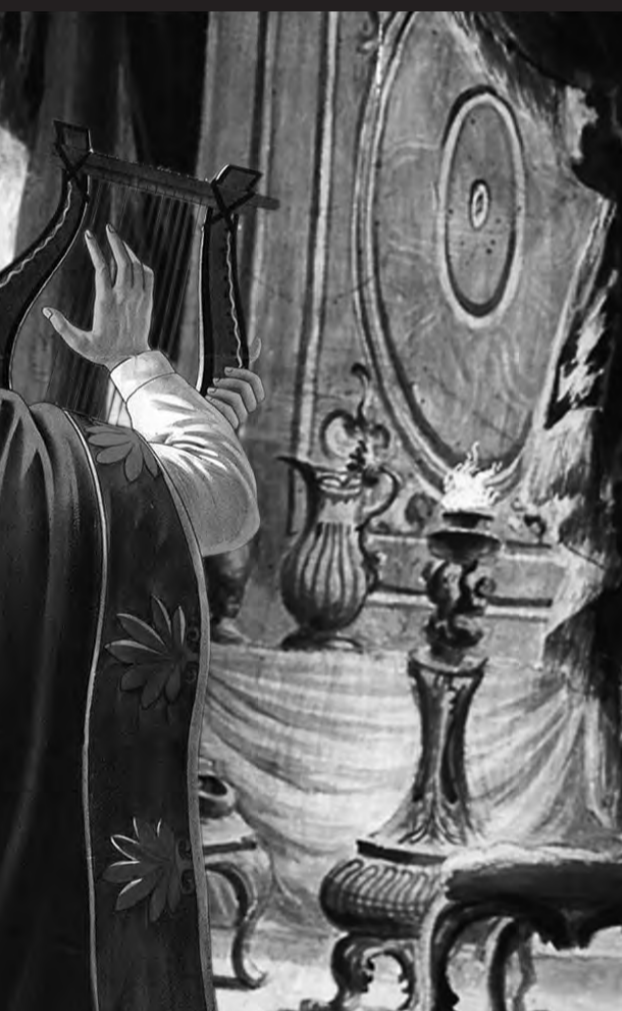
montage Jill Sandjajas (DW) aus zwei Gemäldefotografien.

österreichischen Innenministerium offenbaren die Perfidie der Superverbrecher. Auch diese Papiere gehören ins Spektrum psychologischer Operationen ebenso wie die strategische Kooperation mit den Medien als »Waffe«.