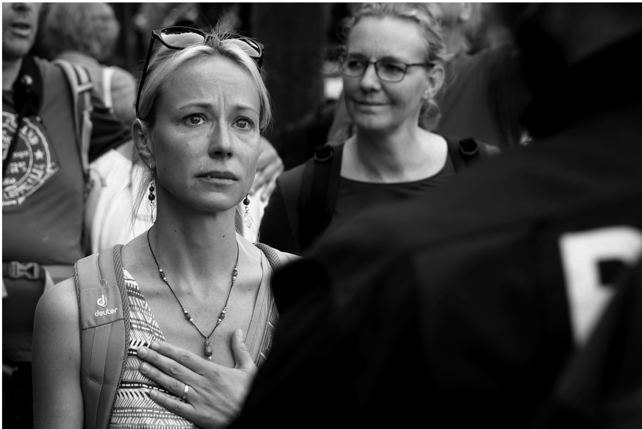
Am 29. und 30. August fand sich die Demokratiebewegung in Berlin ein. Zwei Millionen Menschen trafen sich zur Verfassungsgebenden Versammlung zur Stärkung des Grundgesetzes. Der Senat schickte die Prügeltruppe.

Chinas« genannt. Dazu kommt eine Arbeitswelt, deren Anforderungen an die Lohnabhängigen zunehmend Stress erzeugt, der wiederum das Immunsystem schwächt. Und die These, dass industrielle Massentierhaltung bei gleichzeitigem Zurückdrängen der Wildnis die Überwindung der Tier-Mensch-Schranke für Viren leichter macht und an viel mehr Orten als bisher ermöglicht, ist nicht von der Hand zu weisen. Das vermehrte Aufkommen gefährlicher viraler Infekte ist also eine Folge der Industriegesellschaft.