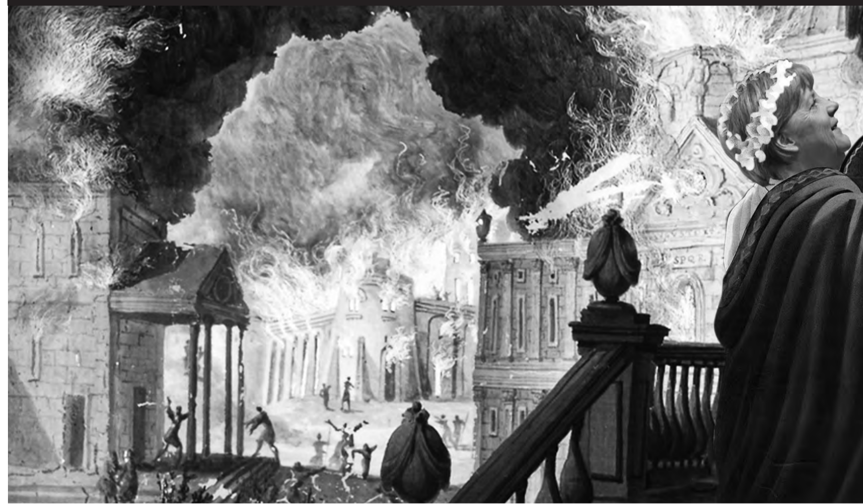
»Die Kanzlerin fedelt das Lied der Alternativlosigkeit vor dem Hintergrund der abfackelnden Zivilisation.« Motiv: Nero vor dem brennenden Rom.

Bis Ende Februar 2020 glaubte ich, eine Ahnung davon, was die Mächte der Macht agieren. Meine Vorstellung zerschellte jedoch an der Realität.