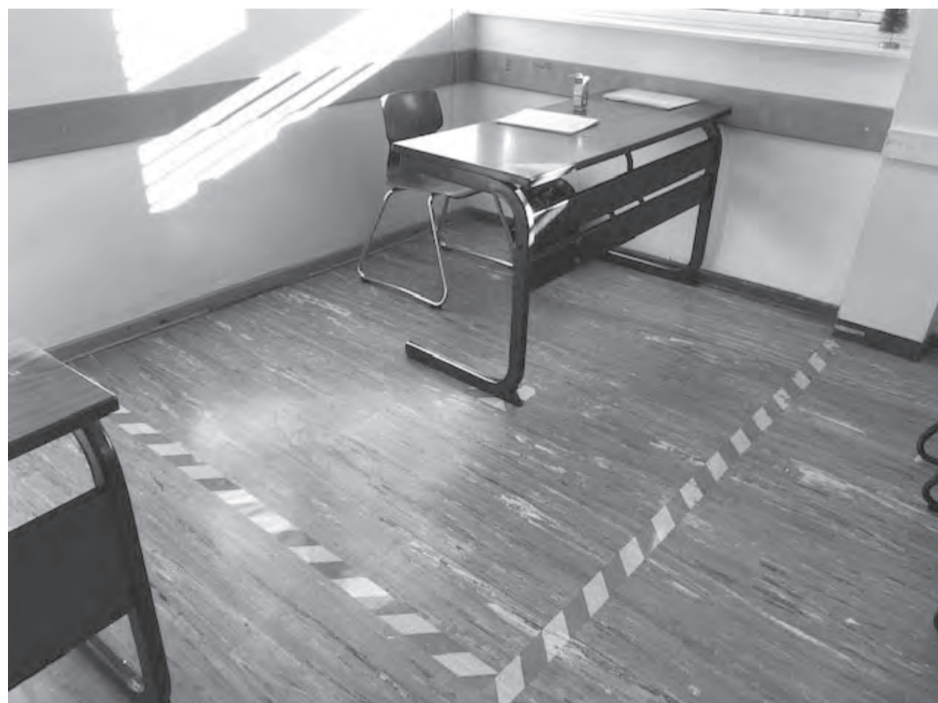
»Lasset die Kinder zu mir kommen«? Umgang mit einer »Aussätzigen« an einer christlichen Schule 2020.

Ich hoffe darauf, dass wir uns – gerade jetzt, da unsere Gesellschaft durch einen Glaubenskrieg namens »Corona-Gefahr« gespalten ist – wieder auf die christlichen Werte besinnen und unsere Mitmenschen nicht ausgrenzen, sondern sie umarmen. Und zwar ganz egal, ob sie eine Maske tragen oder nicht. In diesem Sinne wünsche ich allen ein gesegnetes Weihnachtsfest, ganz besonders Elisa.