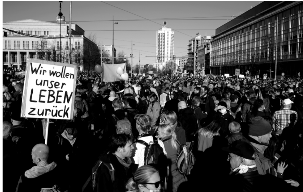
Hunderttausende der Demokratiebewegung in Leipzig am 9. November 2020.