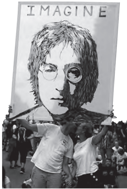
Millionen demonstrierten in Berlin, 29. August.

Die Gespräche führte Sophia-Maria Antonulas