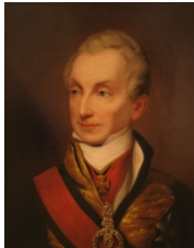
Klemens von Metternich (1773-1859)

Issu de la noblesse allemande, il fait ses études à Strasbourg mais s'oppose à la Révolution puis est contraint de fuir à Vienne. Ambassadeur à Berlin en 1803 puis à Paris en 1806, il devient le Ministre des affaires étrangères autrichien en 1809 et organise le congrès de Vienne à ce titre. Il est nommé Chancelier en 1821 et exerce le pouvoir jusqu'en 1848 où il est chassé du pouvoir lors de la révolte des Viennois.