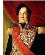
Louis Philippe I er (1773-1850)

Révolutionnaire, patriote et fervent républicain et partisan de l'unité italienne, il combat toute sa vie pour la concrétisation de l'unité italienne et pour l'instauration d'une république. Membre d'une société secrète (les Carbonari) à partir de 1827, il entre dans la clandestinité et la lutte politique. Chef du mouvement « Jeune Italie », il est contraint de s'exiler en France en 1831.