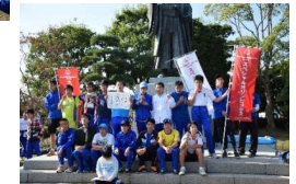
ふれあい駅伝大会