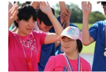
埼玉陸上競技大会

9月14日(土)埼玉陸上競技会にアスリート18名が参加しました。 10月18日(土)つくばリレーカーニバル アスリート&コーチ&ファミリー混合19名 2チーム参加しました。 10月25日(土)ふれあい駅伝大会18名 3チームが参加して3連覇をしました。 11月23日(日)つくばマラソンにアスリート9名が参加しました。