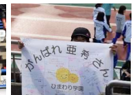
陸上会場で茨城専属のボランティアさんと