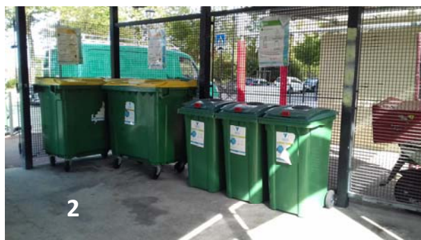
2 rue Scherrer