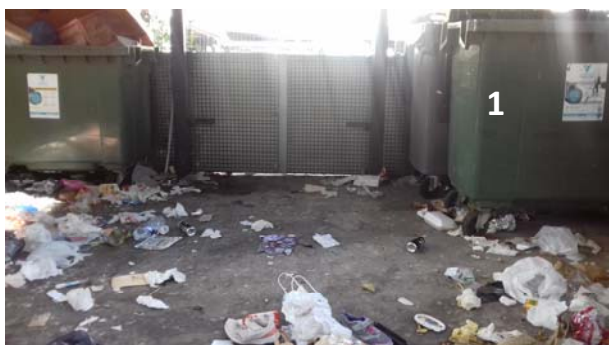
Côté pair de l'avenue du Noyer Doré