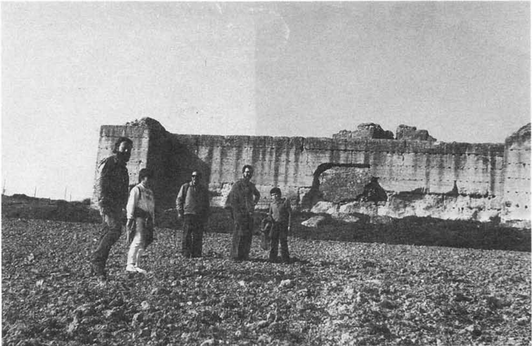
Castillo de Aljonoz, que según al-Nubahi estaba en el límite entre las coras de Cabra y Rayya (Málaga).

A la villa de Iznájar, pertenecían los lugares de Rute y Zambra, «que solían ser de la tierra y jurisdicción de dicha villa» (10).