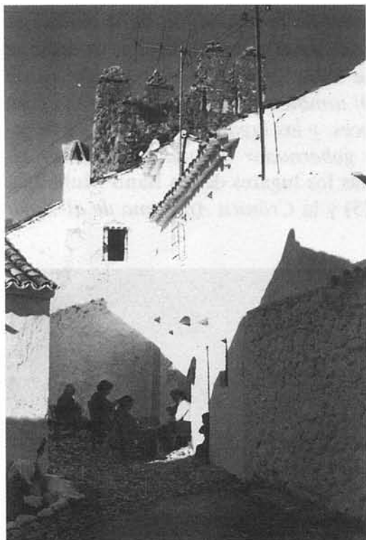
Zuheros: Barrio de la «villa». Al fondo, torreón de la muralla, del siglo XIV.

– Asbarragayra (El Esparragal) y poblada por los bereberes kutamies Jallil y Sa'id ben Muhallab. También poseían la dehesa (y castillo) de Qardayra , Cardera , en Alcaudete. Probablemente se dedicaban a la ganadería. Su pequeño partido se extendería en la Sierra Alcaide y dehesas de la zona.