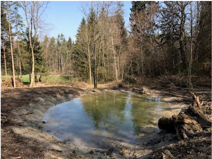
Neuer Kammolchweiher Torgelbomm