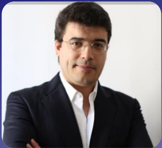
Table ronde avec