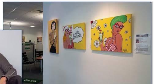
Finissage am 16.01.18, 16 Uhr mit Verlosung