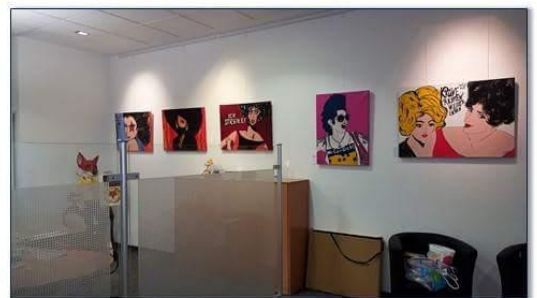
„Menschenbilder“, Vernissage am 28.04.17, 11 Uhr