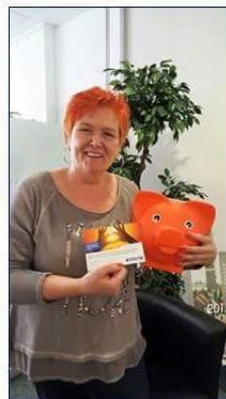
Mit Aktion „Goldenes Herz“ zu Gunsten des Frauenhauses in Leverkusen