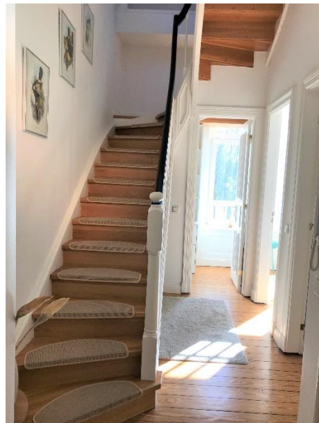
Der Aufgang und Flur