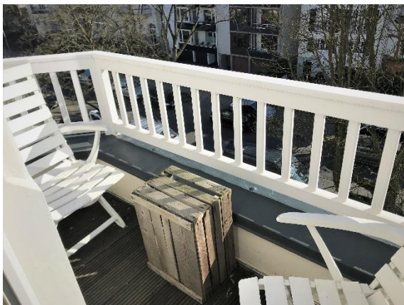
Der Balkon am Schlafzimmer