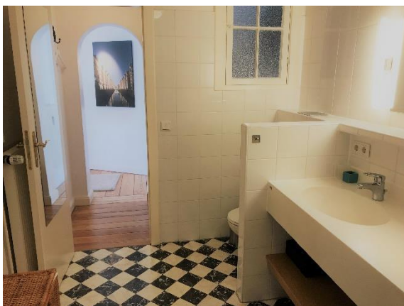
Der Blick aus dem Badezimmer