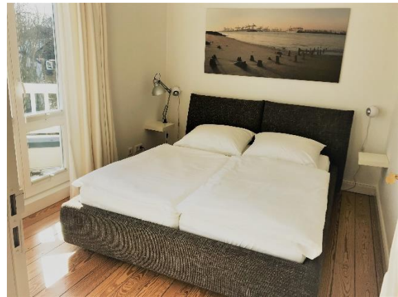
Das Schlafzimmer mit Balkon