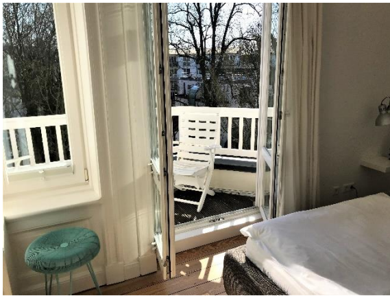
Der Blick vom Schlafzimmer aus