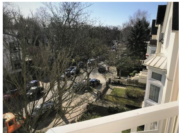
Der Blick vom Balkon