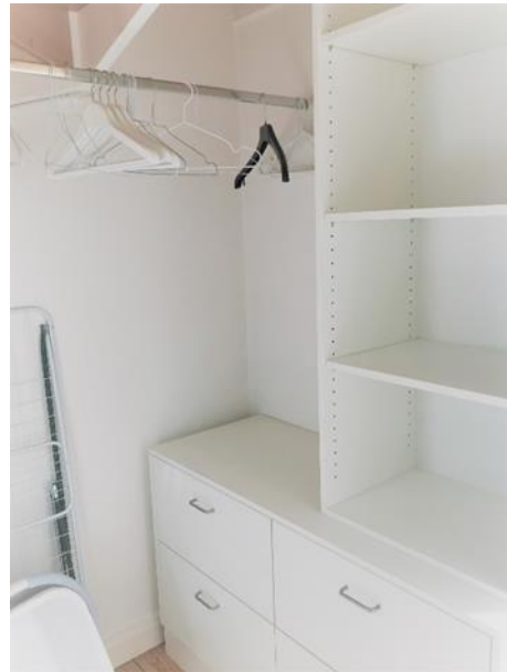
Der begehbare Kleiderschrank