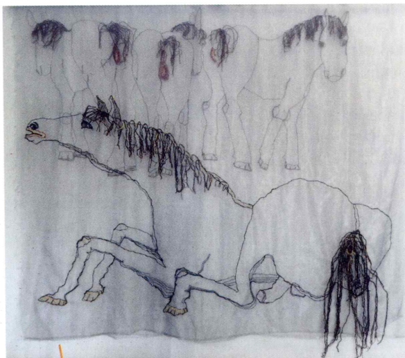
Paardenparadijs, geborduurd op twee achter elkaar geplaatste transparante doeken

De dood is een onmiskenbaar thema in haar werk. "Dat heeft ook met rouwverwerking te maken. Via dode dieren probeer ik de emotie duidelijk te maken die met de dood samenhangt. Ik vraag me af waar het dier na de dood heengaat en of het gelukkig verder kan leven. De dierenhemel noem ik de eeuwige jachtvelden , een beeld dat afkomstig is van de Indianen, een plek waar een dier heerlijk dier kan zijn en kan jagen. Ik breng transparante lagen in mijn werk aan waardoor hij in de ruimte lijkt te zweven. Zo probeer ik hem weer tot leven te wekken."